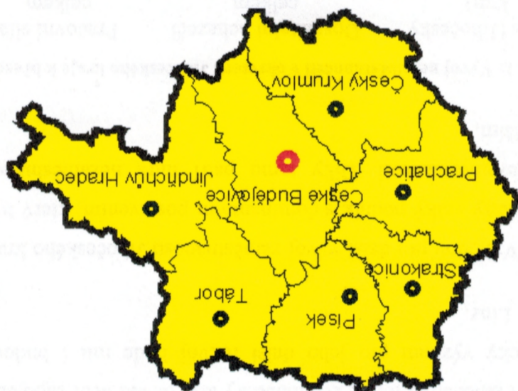
Obrázek 2: Okresy Jihočeského kraje