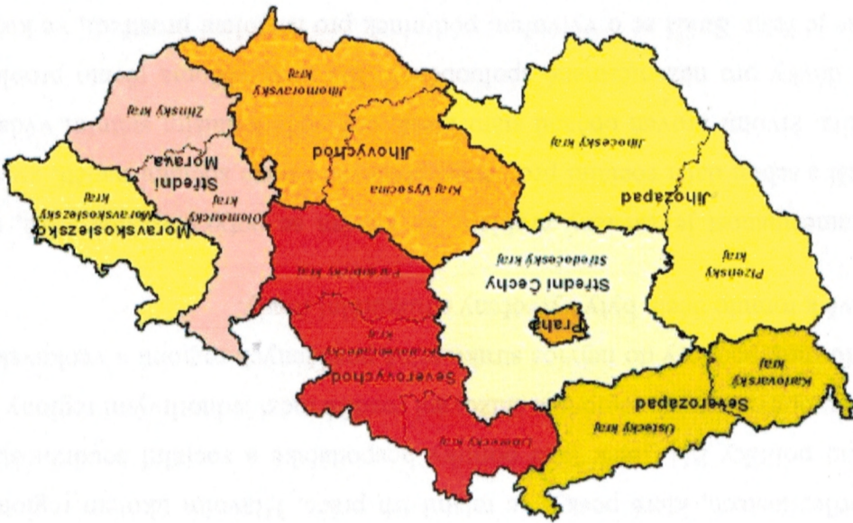
Obrázek 1: NUTS 2 a NUTS 3 v České republice