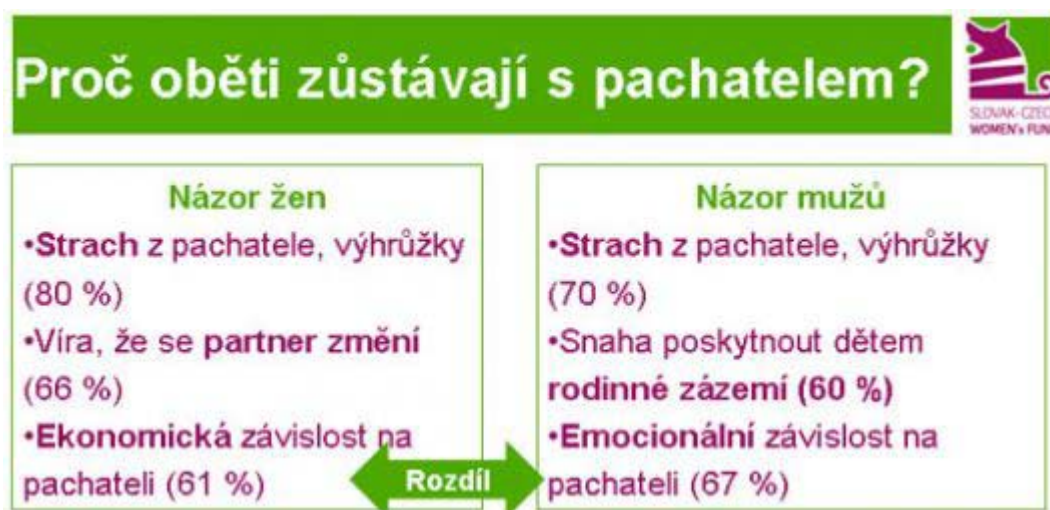
Obr. 1: Proč oběti zůstávají s pachatelem

Domácí násilí se podle Hronkové může podařit vymýtit pouze v případě, že se změní výchova a stereotypy, které se v některých rodinách přenášejí z generace na generaci. „Pokud byl otec agresor, je velká pravděpodobnost, že jeho syn bude jeho chování považovat za normální a bude se odrážet v jeho vlastních vztazích,” dodala. 11