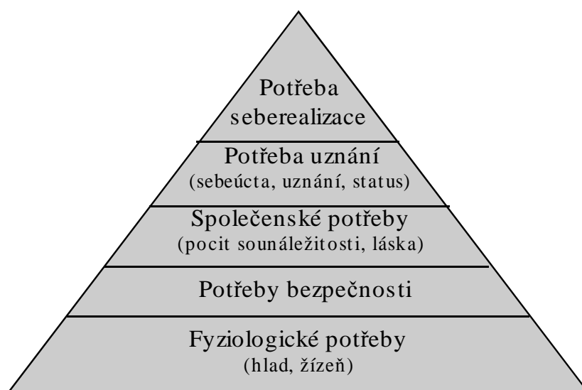
Obrázek č. 2.

Uspokojení potřeby bezpečí je předmětem zájmu, který aktivizuje lidské chování. Saturací potřeby bezpečí a intenzivním zaměřením zájmu o tuto potřebu se bezpečnost stává pro člověka hodnotou. Bezpečnost je teda nejen potřebou, zájmem, ale