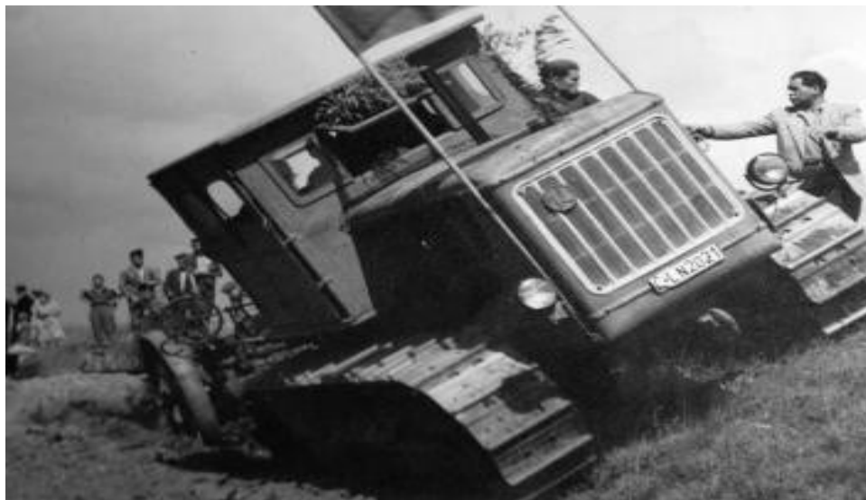
Dobová fotografie o rozorávání mezí

„Kulak se zavře třeba pro jednu slepici nebo sto vajíček, když to bude nutné!“ (citát tajemníka OV KSC Poděbrady 1952)