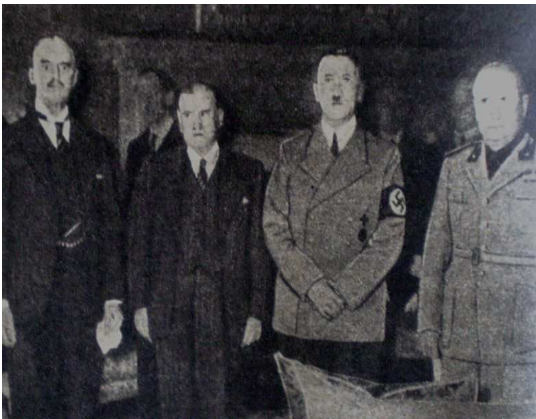
Mnichovská konference - zleva: Chamberlain (Velká Británie), Daladier (Francie), Hitler (Německo), Mussolini