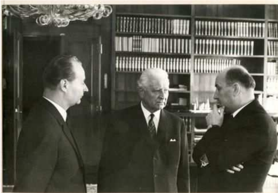
Př. č. 4 – Fotografie nejvýznamějších osob Pražského jara, zleva Alexandr Dubček, Ludvík Svoboda a předseda vlády Oldřich Černík.