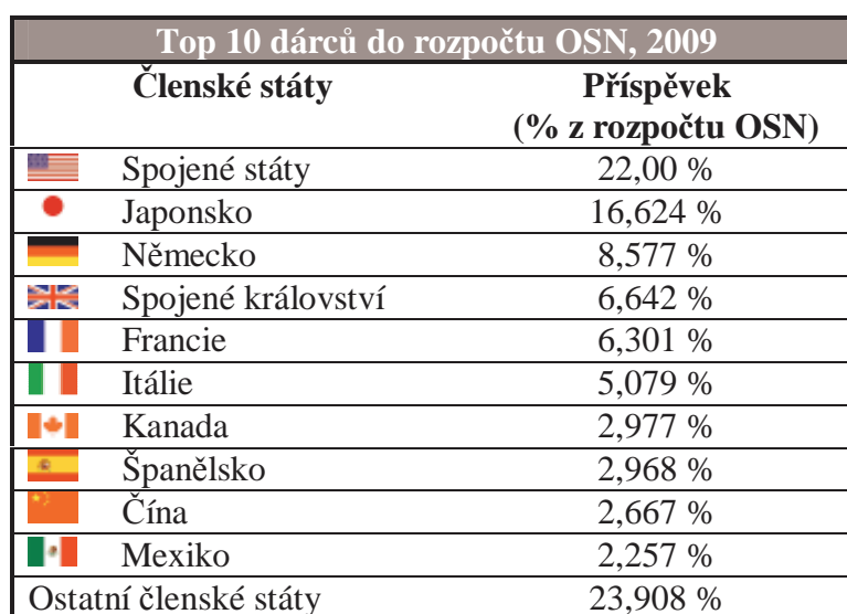
Tab. č. 2: Top 10 dárců do rozpočtu OSN, 2009 27

Ostatní fondy a programy OSN, např. Dětský fond OSN (UNICEF), Rozvojový program OSN (UNDP) nebo Vysoký komisariát pro uprchlíky (UNHCR) mají samostatný rozpočet. Z větší části jsou financovány prostřednictvím dobrovolných příspěvků vlád i jednotlivců, jako je tomu v případě UNICEF. Vzhledem k tomu, že financování je dobrovolné, mnohé z těchto agentur trpí ekonomickým nedostatkem z důvodu ekonomické recese. V červenci 2009 oznámil Světový potravinový program, že je nucen omezit poskytované služby pro nedostatek finančních prostředků. 28