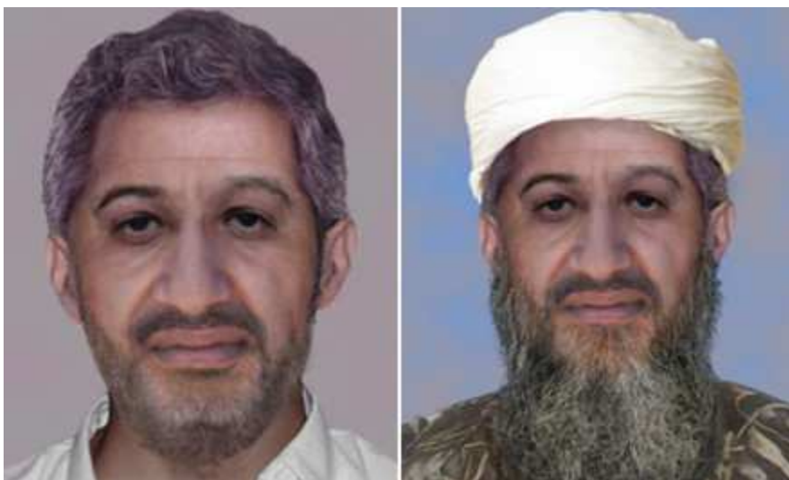
Foto: Usáma bin Ládín, zdroj: z www: http://tn.nova.cz/zpravy/zahranici/foto-fbi-zverejnila-jak-by-dnes-mohl-vypadat-usama-bin-ladin.html .

FBI zveřejnila dva snímky. Na prvním je arciterorista bez vousů a s krátkými prošedivělými vlasy, má na sobě západní oblečení. Na druhém vypadá tak, jak ho zná celý svět – je zarostlý a v tradičním oděvu s bílým turbanem na hlavě.