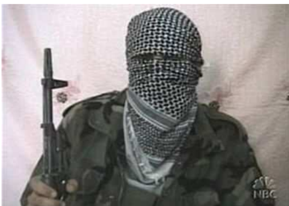
Foto: Terorista, zdroj: z www:< http://i.pravda.sk/07/084/skcl/P231d6aa3_talibanV.jpg> .