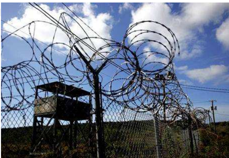
Foto: Guantánamo, zdroj: z www:< http://zpravy.idnes.cz/foto.asp?r=zahranicni&foto1=AD1d1443_GUANTANA.JPG> .

Věznice na kubánské základně Guantánamo funguje od roku 2002. Od té doby zařízením prošlo na osm stovek lidí, které Američané a jejich spojenci pochytili během tažení proti teroru. Zadržení pobývají ve věznici v právním vakuu - bez obvinění a soudu. A to vzbuzuje nevoli po celém světě. Guantánamo je jedním z problémů, které navenek poškozují obraz USA coby reprezentanta demokracie a lidských práv. I proto loni v lednu rozhodl americký prezident Barack Obama kontroverzní věznici do roka uzavřít. To se mu nepodařilo, na Kubě stále zůstává přes dvě stě vězňů. Americká vláda nyní řeší, kam je umístit. Některým by totiž v jejich zemích mohlo hrozit pronásledování. Američané požádali zejména evropské státy o přijetí některých vězňů.