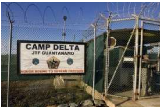
Foto: Guantánamo, zdroj: z www:< http://www.tyden.cz/obrazek/49bce548d20b4/guantanamo-49bce80a42094_275x183.jpg> .