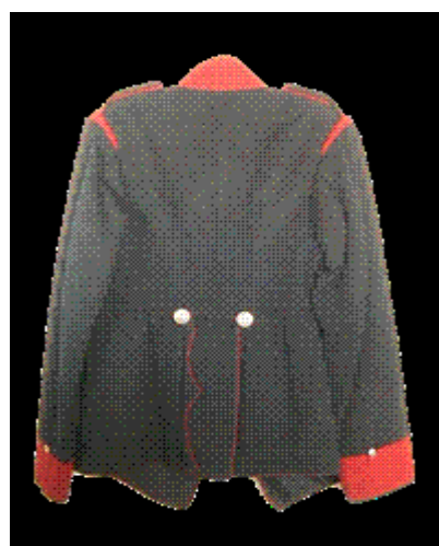
Obrázek 2. Část uniformy městské policie