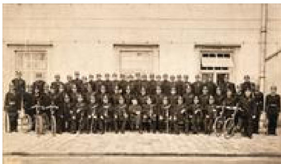
Obrázek 1. Uniformovaný policejní sbor

samosprávného městského policejního úřadu však početní stav četnictva nebyl vysoký.