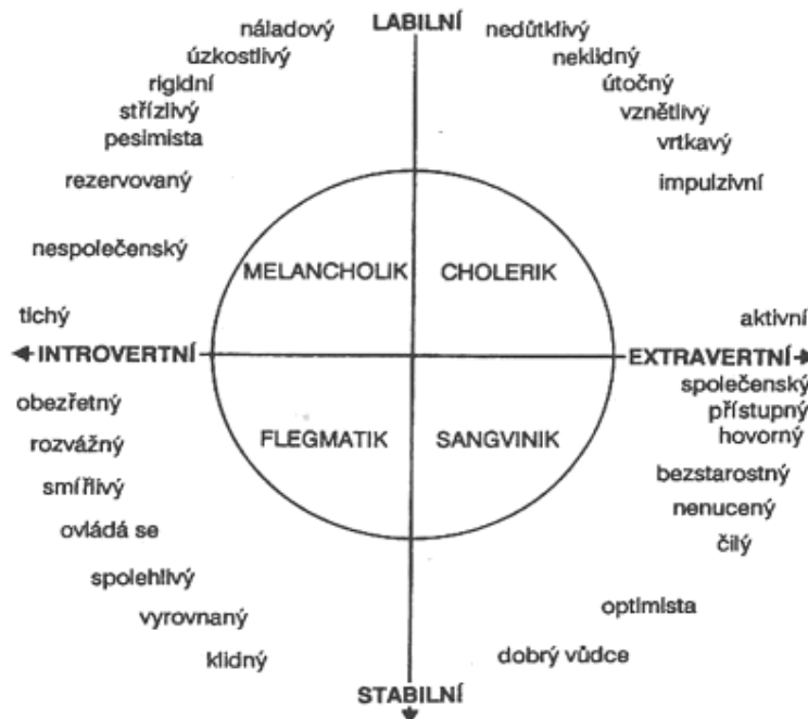
Graf č. 2 Schéma vlastností a typů temperamentu podle Eysencka

Zdroj: BALCAR, K. Úvod do studia psychologie osobnosti . Praha, 1983. s. 97.