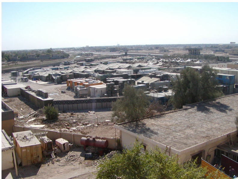
Obr. 4: 7. polní nemocnice 78

Byla prvkem kontingentu, který byl předurčen k poskytování humanitární pomoci a lékařské péče místnímu obyvatelstvu pro zmírnění dopadů poválečného stavu, lékařské péče příslušníkům ozbrojených sil států zapojených do stabilizačních sil IZ SFOR působících na území Iráku a poskytování odborné lékařské pomoci příslušníkům kontingentu. Dalším úkolem 7. polní nemocnice bylo poskytování lékařské péče iráckým zajatcům za asistence sil koaličních armád.