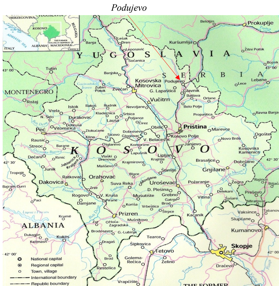
Obr. 2: Situační mapa Kosova 63

V knize NA CESTĚ INTEGRACE 64 se uvádí, že od 19. února 2002 do poloviny roku 2005 plnil úkoly operace KFOR společný česko-slovenský kontingent v síle mechanizovaného praporu. Necelých 400 českých a 100 slovenských profesionálů. Česko-slovenský mechanizovaný prapor převzal prostor odpovědnosti o rozloze 120 km 2 . K dalšímu rozšíření prostoru působení došlo 28. března 2002, kdy se severní část rozrostla o 187 km 2 . Prostor odpovědnosti se i neustále postupně zvětšoval. Od působení 4. česko-slovenského praporu v období od října 2003 do května 2004 byl tento prostor rozšířen až na 1 150 km 2 a délka hranice mezi provincií Kosovo a Srbskem se ustálila na 104 km. Do ukončení činnosti současného kontingentu tvoří prostor odpovědnosti území o rozloze přibližně 845 km 2 a délka provinční hranice se ustálila na 112 km.