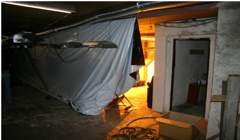
Příloha č. XX.