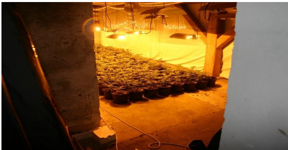
Obr. č. 7. Odhalená vietnamská in-doorová pěstírna.

V ČR se tímto způsobem pěstování konopí zabývají především občané Vietnamu (až z 80%), kteří se donedávna zabývali jinou ilegální trestnou činností, zejména nelegální výrobou cigaret, paděláním kolkových známek apod. Hierarchie pěstitelů je specifická. Přímo v pěstírně se zdržují podřadní pěstitelé, většinou jde o Vietnamce zdržující se v ČR ilegálně, či Vietnamce stíhané a hledané pro jinou trestnou činnost. „Zahradníci“ (osoby, které se starají o zdárný průběh pěstebního cyklu konopí) se zdržují v pěstírně po celou dobu vegetativního období rostlin a to i v několika cyklech za sebou. Rostliny zalévají, obhospodařují a hlavně hlídají samotnou pěstírnu. Nejen kvůli dozoru nad průběhem vegetačního života rostlin, ale i kvůli nebezpečí jejich krádeže či krádeže sklizně jinými skupinami pěstitelů a dealerů. Tito „zahradníci“ navštěvují v místě pěstírny jiní Vietnamci, kteří dovážejí sazenice rostlin, hnojivo a jídlo pro dělníky. Jiní Vietnamci si do pěstírny přijíždějí pro sklizeň, kterou následně distribují. Zřídka kdy se tyto lidé navzájem vůbec znají. Z pohledu státních orgánů je velmi složité při odhalení pěstírny tento spletenec rozkrýt a jednotlivé pachatele trestně stíhat jako organizovanou skupinu.