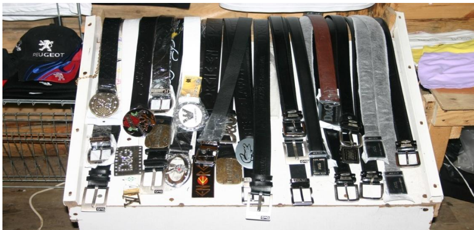
Příloha č. IV.