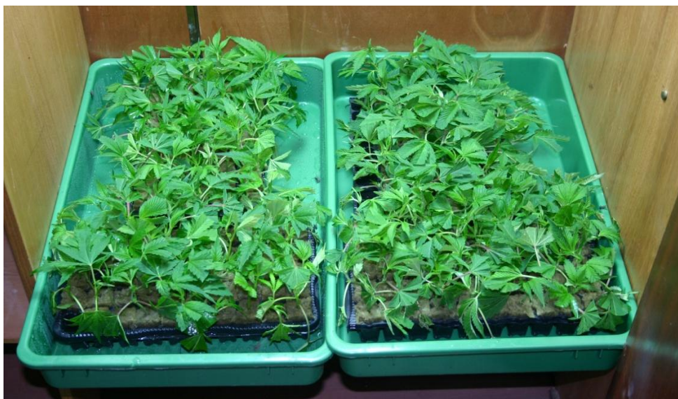
Příloha č. XVIII.