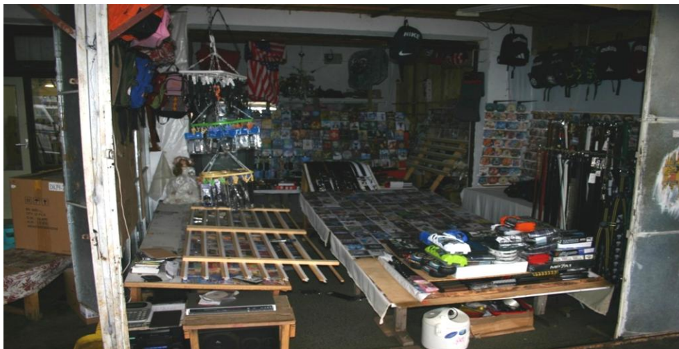
Obr. č. 6. Prodej padělaných CD a DVD.

Kontrolní úlohu mají celní orgány 32 a Česká obchodní inspekce, jež při kontrolách zajišťují padětky a případy řeší jak v trestním, tak ve správním řízení. Příslušnými soudy jsou za výše popsané delikty vyslovovány sankce, zpravidla propadnutí věci, někdy kombinované se zákazem pobytu na příslušném místě. Zákaz pobytu zpravidla nevyřešil vůbec nic, osoba se pouze přemístila do dalšího okresu a páchala trestnou činnost dál.