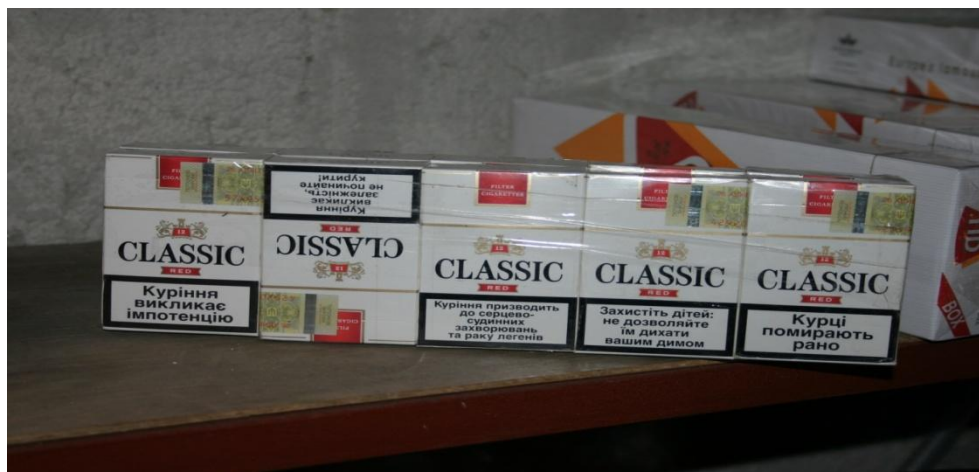
Obr. č. 3. Dovoz nezdaněných cigaret.

dovozy neznačených cigaret z Polska. Tyto dovozy jsou obvykle kryty neutrálním zbožím, potravinami, čajem, drogistickým zbožím a podobně. Jedná se buďto o cigarety vůbec neopatřené zákonem předepsanou tabákovou nálepkou, nebo jsou opatřeny tabákovou nálepkou např. Litvy, Lotyšska, Ukrajiny apod. (obr. č. 3)