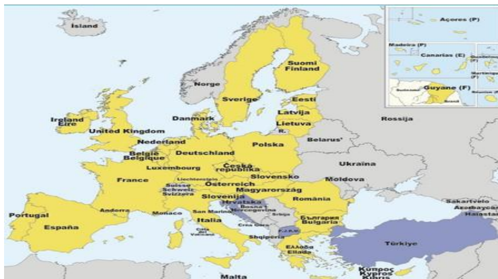
Obr. č. 2. Mapa států EU.

Príslušné kontrolní orgány mají oprávnění od kontrolovaných osob požadovat doklady osvědčující totožnost kontrolovaných osob, např. pas, jiné cestovní doklady, apod. Dále dokumenty k doložení pracovníprávního vztahu či jiné smlouvy, povolení k zaměstnání, pokud zákon jeho vydání vyžaduje nebo zelenou kartu 25 a předložení povolení k pobytu. Kontrolovaný subjekt je povinen zajistit v provozovně určené pro prodej zboží nebo poskytování služeb spotřebitelům přítomnost osoby splňující podmínku znalosti českého nebo slovenského jazyka, viz § 31 odst. 8 zákona č. 455/1991 Sb., zákon o živnostenském podnikání (živnostenský zákon). Je třeba si položit otázku, je možno určit počet cizinců pracujících v šedé ekonomice? Stanovením počtů se zabývá Český statistický úřad, viz následující tabulky kontroly v oblasti zaměstnávání cizinců.