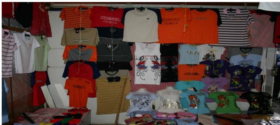
Obr. č. 5. Vystavené padělky textilu ve vietnamském stánku.

Co naopak v těchto prostorách funguje skvěle, je systém ochrany a včasného varování před dozorovými státními orgány. Již několik kilometrů před vlastními