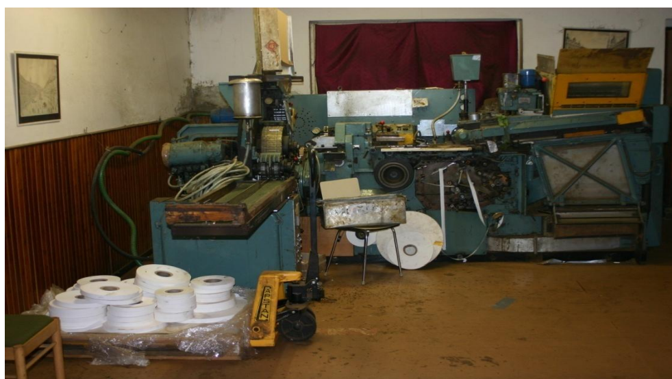
Obr. č. 4. Stroj užitý k nelegální výrobě cigaret.

Zásadním problémem je obstarání vhodného upraveného, řezaného a fermentovaného tabáku k výrobě cigaret, který je nutno dovézt ze zahraničí. Část tabáku je nakupována od dodavatelů, od kterých jej odebírají i renomované světové cigaretové společnosti, část je druhořadý nekvalitní tabák. Klíčovým problémem je přeprava tabáku k výrobní lince. Dochází k chybnému označování zboží, k jeho rozdělování po dovozu do České republiky na více drobných zásilek, aby případná ztráta byla minimální, jsou používány mezisklady za účelem „očistění“, tedy přesvědčení se, že zásilka není monitorována státními orgány. Tato činnost je velmi náročná a existuje vysoké riziko odhalení. Z tohoto důvodu organizované skupiny přistoupily k tzv. ředění tabáku kvalitního, tabákem nekvalitním, který je do tuzemska dopravován jako celé tabákové sušené listy. Takový to tabák není zatížen spotřební daní na rozdíl od tabáku řezaného, který spotřební dani podléhá. Tím docházelo a dochází k enormnímu množství dovozu tabákového listí do tuzemska a do Evropy vůbec, které se po dovozu ztratí orgánům státní správy, je nařezáno a slouží k výrobě cigaret. Zajímavé je, že z jedné hromady takto připraveného tabáku jsou pak vyráběny cigarety