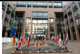
Sídlo Rady, budova Justus Lipsius