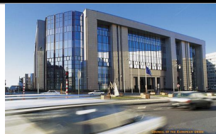
Brusel, budova Justus Lipsius, kde se ER nejčastěji schází