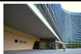
Budova Berlaymont – sídlo EK