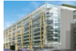
Budova EHSV v Bruselu