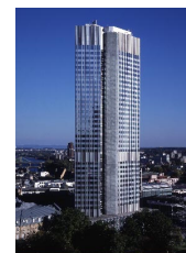
Eurotower - Sídlu ECB

Vlastní tabulka, údaje + fotografie čerpány z Věcně o Evropě. Instituce EU [online]. 2011 [cit. 1. 2. 2011]. Euroskop.cz. Dostupné z WWW: < http://www.euroskop.cz/76/sekce/instituce-eu/ >.