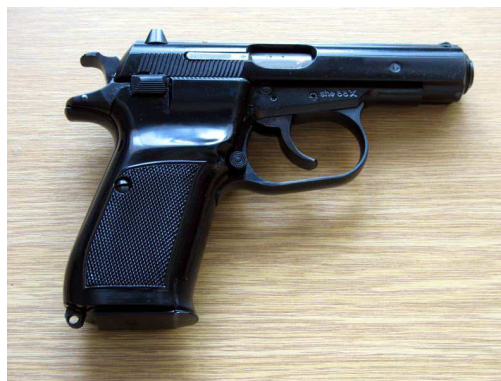
Obr. 5 pistole vzor 82 ráže 9mm makarov

Pistole vzoru 82 je zbraň určena k vlastní obraně a boji na malé vzdálenosti, neboť je její účinný dostřel přibližně 50 metrů. Jedná se o samonabíjecí pistolí s pohonem založeným na impulsu výstřelu.