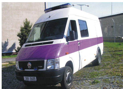
Obr. 1 Volkswagen LT 40

střeše vozidla, případně doplněna kulatými majáky připevněnými k masce vozu a zvukovou sirénou. Podle typu eskorty a počtu odsouzených se používá buď vozidlo Volkswagen LT 40 (viz obr. č. 1), Volkswagen T4 kombi – sanita (viz obr. č. 2) nebo vozidlo autobus Karosa C954E (viz. obr. č. 3).