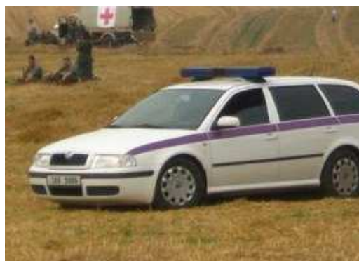
Obr. 4 Škodou Octavia kombi

Tato vozidla mohou být v oprávněných případech, jako jsou například eskorty zvláště nebezpečných osob, či mimořádné eskorty doprovázena osobním vozem vězeňské služby Škodou Octavia kombi (viz obr. č. 4).