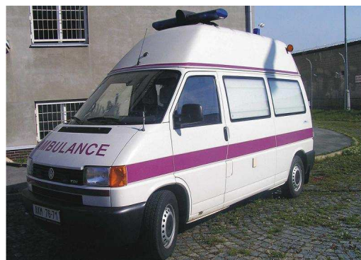
Obr. 2 Volkswagen T4 kombi – sanita