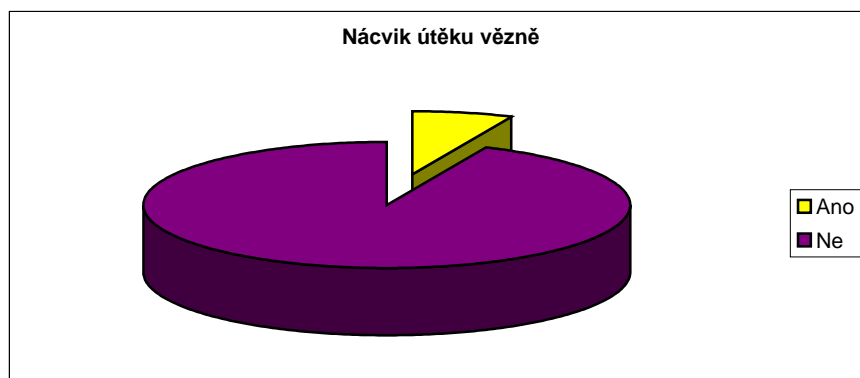
Obr 8 Nácvik útěku vězně