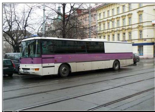
Obr. 3 autobus VSČR Karosa C954E