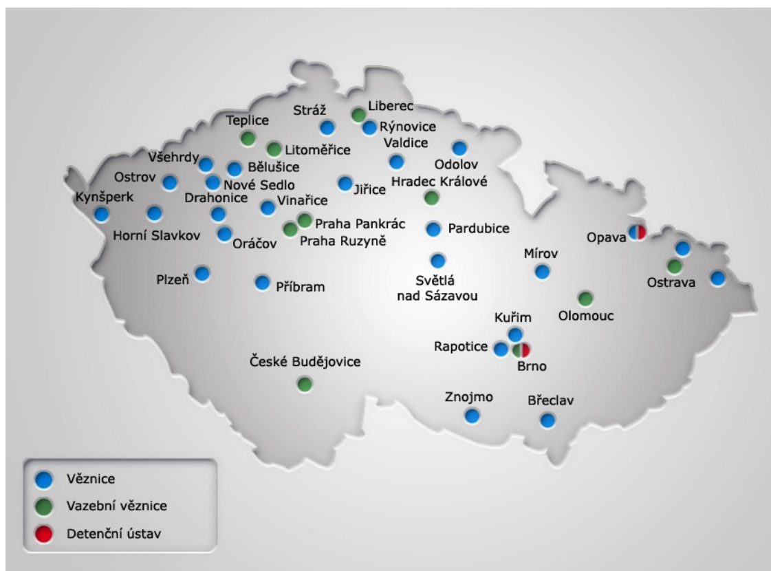
Obr. č. 1 Umístění věznic, vazebních věznic a detenčních ústavů v ČR

Pramen: Vězeňská služba České republiky.