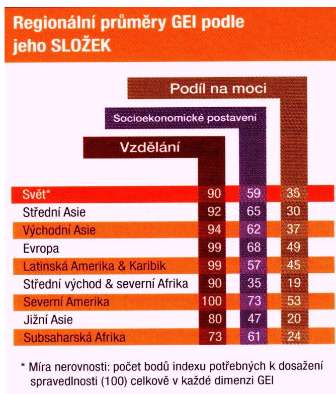
Tabulka č. 2: Regionální průměry GEI 13

Jak je vidět, Evropa je v této otázce celkově na velice dobré úrovni. Vzdělání je jedinou složkou, kde mnoho zemí poslední dobou dosáhlo parity. Což je, dá se soudit, velice dobrý krok, který povede k postupnému přiblížení se i v ostatních oblastech. Ale nejen to. Za vysokým podílem vzdělání žen se skrývá jejich osobní zájem a snaha vylepšit svůj život, získat lepší práci, zvýšit si nejen vzdělání, ale i sebevědomí, nebo mít možnost žít nezávisle na partnerovi. Vzdělávání je jeden z prvních kroků ke zlepšení postavení žen vůči mužům. A nejde samozřejmě jen o vyšší postavení