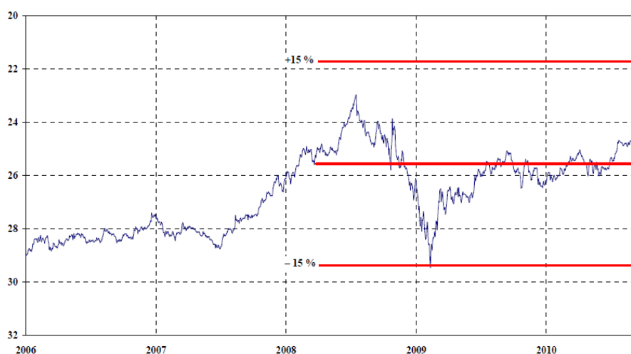
Graf 2: Kritérium stability kurzu měny 93

ČR svou korunu dosud do systému ERM II nezapojila. Z tohoto důvodu není stanovena centrální parita k euru, vůči níž by se sledovalo plnění kritéria.