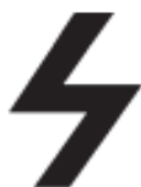
Fašistická symbolika Symbol Sig Rune