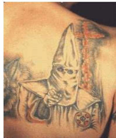
Vytetovaný symbol Klansmana Ku Klux Klanu