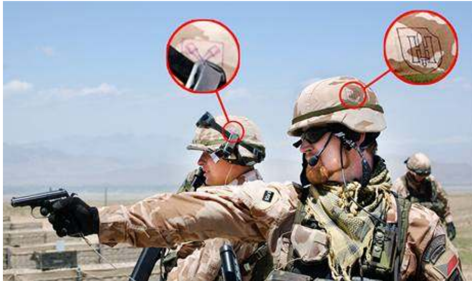
Použité symboly příslušníky AČR – mise Afganistán 2009