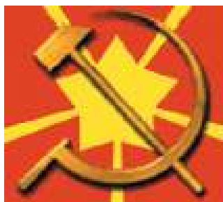
Znak Komunistické strany Československa – Československé Strany práce