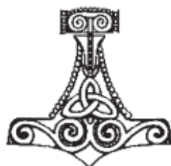
Thorovo kladivo (Mjólnir)