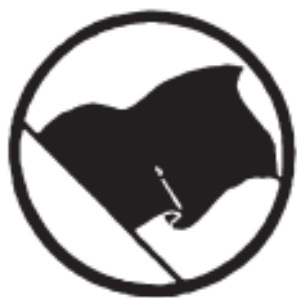
Stylizovaná černá anarchistická vlajka