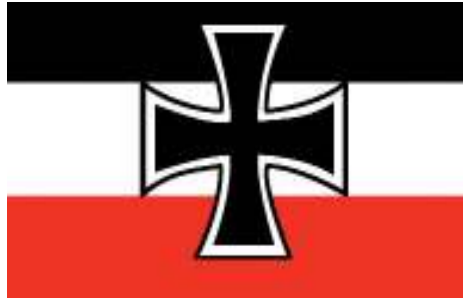
Německá válečná říšská vlajka z let 1935 – 1945 s německým válečným křížem