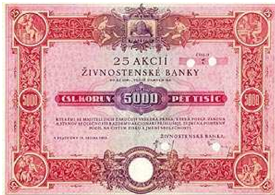
Akcie Živnostenské banky z roku 1933