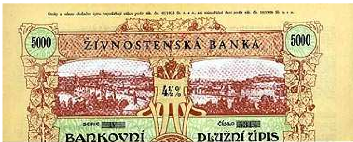
4 1/2% bankovní dlužní Živnostenské banky