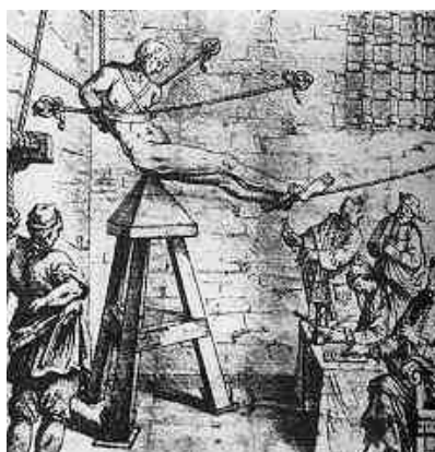
Obrázek č. 1: Jidášova židle 24

Odsouzený byl vytažen nad špici pyramidy, poté opakovaně a prudce byl na ni spuštěn tak přesně, aby špice pronikla do řitního otvoru, pod varlata nebo pod kostrč, a v případě odsouzené ženy do pochvy - což způsobilo obviněným příšerné bolesti. Často oběť bolestí omdlela. Tehdy celá operace byla přerušena a pokračovalo se až poté, co oběť nabyla vědomí. Na základě této procedury "bdění" dostalo název "kolébka". 23