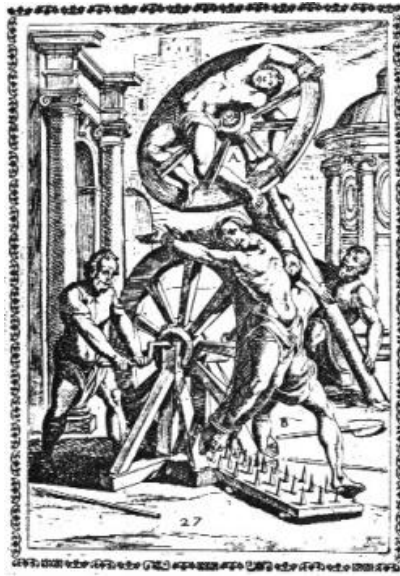
Obrázek č. 2: Mučící kolo 26

se oběť, již zapletená, umístila na vysokou tyč, kde čekala na smrt. Často se stala potravou pro ptáky. 25