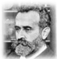
Obrázek č. 8: Louis Alphonse Bertillon 75

Louis Alphonse Bertillon patří mezi osobnosti, které se nesmazatelně zapsaly do historie zločinu a kriminalistiky. Celý svůj život zasvětil boji proti zločinu. Jako první na světě vypracoval použitelnou metodu individuální identifikace zločinců, postavenou na vědeckém základě – proměřování jednotlivých částí lidského těla. 76