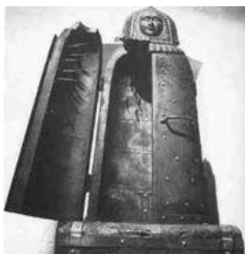
Obrázek č. 5: Norimberská panna 35

Původ označení tohoto mučidla pochází zřejmě z Norimberku a název panna dostal podle podoby bavorské dívky. Odsouzený k tomuto trestu byl zavřen do sarkofágu, kde byly naraženy velice silné, hrubé hřeby, kterými se propíchno tělo nešťastníka. Rozmístění bodlin nebylo náhodné – propíchnuly sice tělo na různých místech, ale nezasáhly životně důležité orgány, proto byla oběť naživu ještě velice dlouho. První svědectví pochází z roku 1515, kdy byl tento trest uložen jednomu padělateli, který v sarkofágu zůstal tři dny v šílených mukách. 34