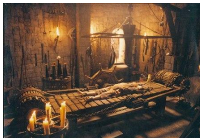
Obrázek č. 4: Lavice na natahování 33

prsních bradavek nebo jiných citlivých částí, popřípadě mučen pomocí neblaze proslulých žhavých želez. 32