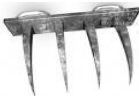
Obrázek č. 3: Španělské lechtání 31

Toto zařízení, velikosti lidské ruky, bylo používáno k tomu, aby roztrhalo na cáry maso oběti a aby obnažilo kosti na všech místech těla: ve tváři, na břiše, na zádech, na kloubech, na hýždích, na prsou. 30