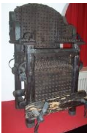
Obrázek č. 6: Inkvizitorská židle 37

Inkvizitorská židle byla užívána ve Střední Evropě až do roku 1846 během "řádných" vyšetřovacích řízení. Obviněný byl na ni nahý posazen tak, aby při sebemenším pohybu ostré bodliny mohly proniknout do masa. Trest byl prodlužován na mnoho hodin a kat často zvyšoval utrpení i tím, že tloukl oběť do údů, používal kleště, šrouby a drtiče prstů, nebo jiné nástroje. Židle měly různé rozměry, rozličné tvary a variace podle fantazie. Ovšem všechny byly vybavené hřeby a pouty nebo jiným ústrojem, aby oběť držely nehybnou. 36