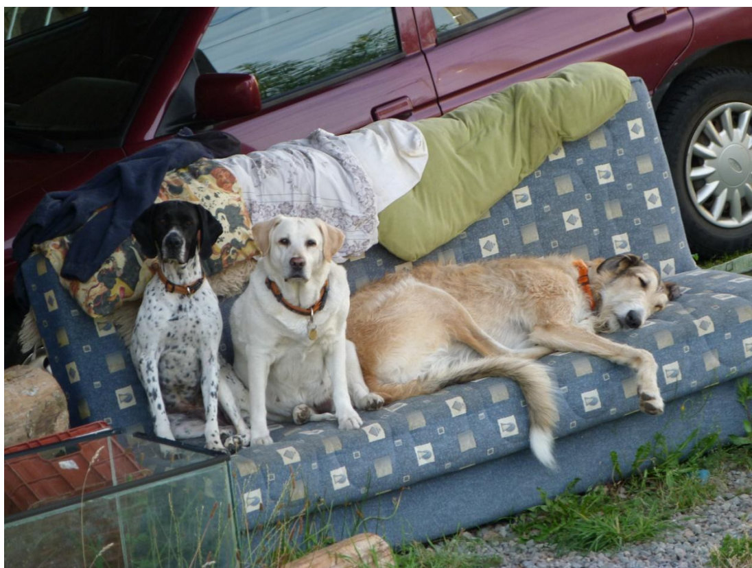
Příloha 10- Whiskas v domově pro seniory