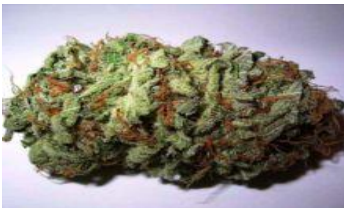
Obr. č. 3: Marihuana, cizí zdroj 35

Marihuana jako produkt vypěstované rostliny konopí se řadí: