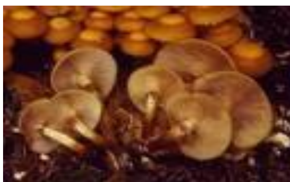
Obr. č. 2: Lysohlávky, cizí zdroj 29

Extázi (MDMA) vyvinuli v roce 1912 poprvé dva němečtí chemici v rámci velkého výzkumného programu farmaceutické a výzkumné společnosti Merck, a tato látka byla patentována jako lék na omezení apetitu, tedy při dietách, ale jako lék se na trh nikdy nedostala a na ulici se objevila v sedmdesátých letech pod názvem „droga lásky“. Začátkem 80. let se extáze co by tzv. „taneční“ droga rozšířila po celé Evropě, a do roku 1985 byla dokonce volně prodejná v barech a klubech. 30