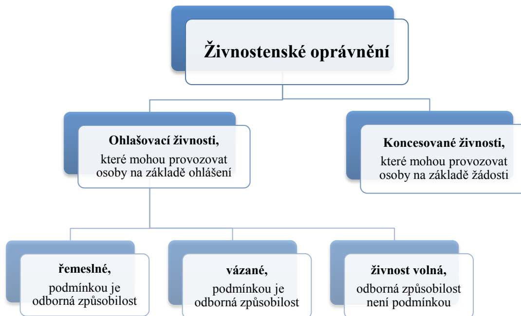
Obr. 2: stručný přehled druhů živnosti

Živnostenský zákon dělí živnosti na ohlašovací a koncesované. 17 Živnosti ohlašovací jsou dále rozděleny na živnosti řemeslné, vázané a volné.