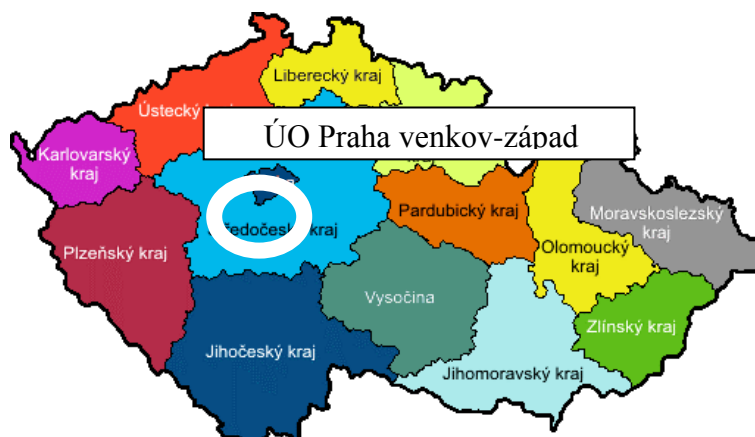
Obrázek : Územní odbor Praha venkov – Západ 60