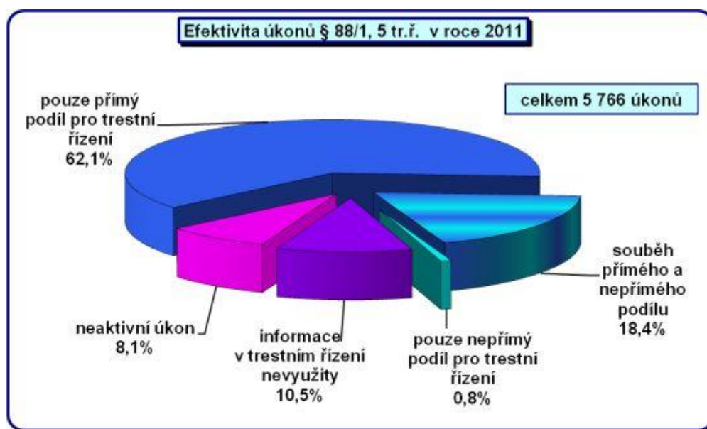
Graf č. 3. Efektivita úkonů § 88/1, 5 TrŘ. v roce 2011 48

Dalším, často ne zcela zřetelným faktorem, který ovlivňuje statistiku odposlechů, je vysoká „úmrtnost“ telefonů. To znamená, že dojde k situaci, že dříve nežli takový mobil začneme odposlouchávat, je již odpojen, případně není účastníkem využíván. Z následujícího grafu vyplývá, že takových neaktivních úkonů bylo v roce 2011 8,1 % neaktivních, resp. nerealizovaných z celkem 5 776 úkonů. Vedle této informace nám graf poskytuje informaci, s jakou efektivitou bylo využíváno odposlechů v roce 2011. Efektivita byla kriminalisty vyhodnocena ve více než 62 % úkonů v přímém podílu pro trestní řízení (bez souběhu s nepřímým podílem), v 0,8 % pouze v nepřímém podílu pro trestní řízení a v dalších více než 18 % souběžně v obou těchto kategoriích. Celkově se tedy účinnost z hlediska přímého, nepřímého či současně obou těchto podílů vykazovala u více než 81 % případů. V 10,5 % úkonů nebyly získané informace v trestním řízení využity, v těchto případech by pak bylo možno dané úkony považovat za neefektivní.