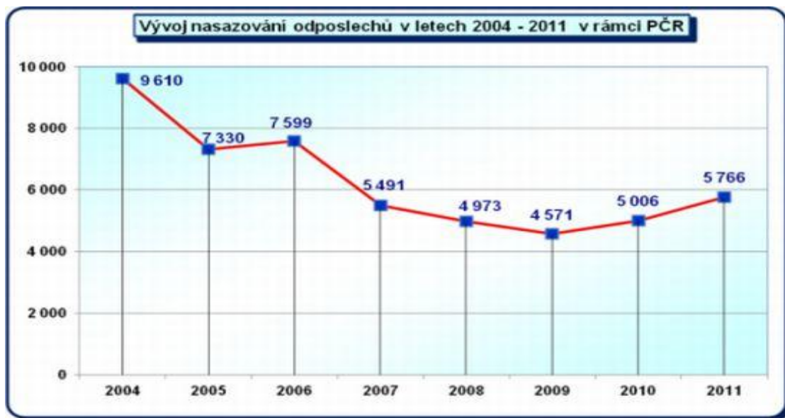
Graf č. 1. Vývoj nasazování odposlechů v letech 2004 – 2011 v rámci PČR 46

Při porovnání počtu odposlechů realizovaných v roce 2011 oproti roku 2004 je evidentní značný pokles v nasazování těchto úkonů (3 844, tj. 40 %).