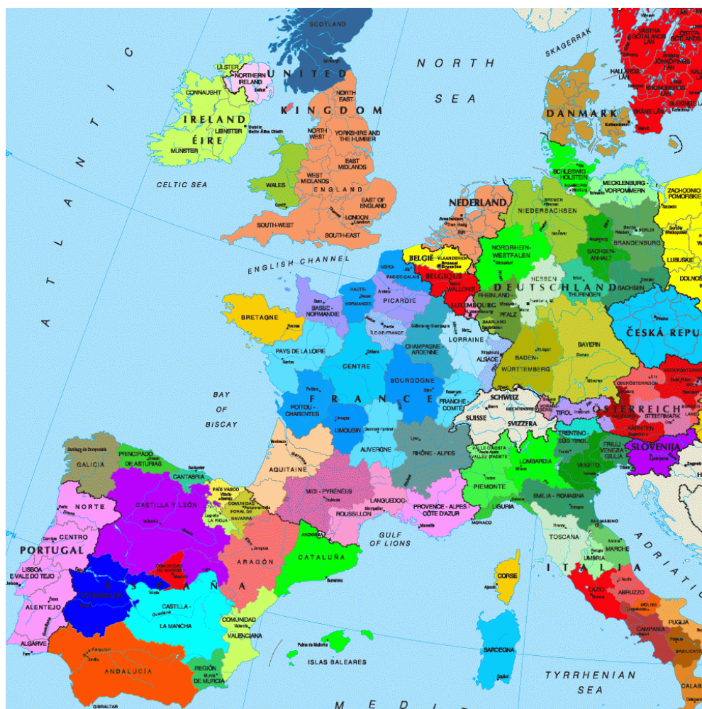
Obrázek č. 1 : Regiony Evropy 72

Evropský vývoj se bude v budoucnosti ubírat spíše cestou rozvoje víceúrovňového vládnutí. Dá se očekávat, že význam některých regionálních hnutí bude sílit, zatímco jiná budou na významu spíše ztrácet. Je možné, že se vyprofilují taková regionální hnutí, která budou schopna vytvořit vlastní stát. Oproti tomu regionální hnutí s menším státotvorným potenciálem se v budoucnu mohou přeměnit z hnutí politických v hnutí kulturní. Tyto transformace závisejí na politizování regionality daného regionálního hnutí. 71