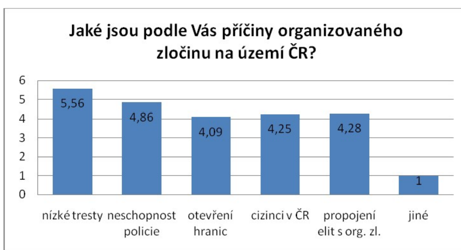
Graf č. 2: Odpovědi respondentů na otázku č. 5 36

Nelegální migrace a obchod se zbraněmi jsou hodnoceny téměř vyrovnaně. Naopak obchod s lidskými orgány je českou společností vnímán spíše jako problémem zahraničních zemí, zejména chudších, nebo méně vyspělých (Čína, Afrika, Indie aj.), kde je černý trh s orgány daleko více rozšířený.