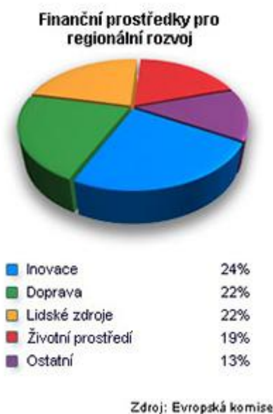
Graf 1 - Finanční prostředky regionálního rozvoje EU 24

Finanční prostředky EU, které jsou vynakládány na regionální rozvoj, obsahuje níže uvedený graf.