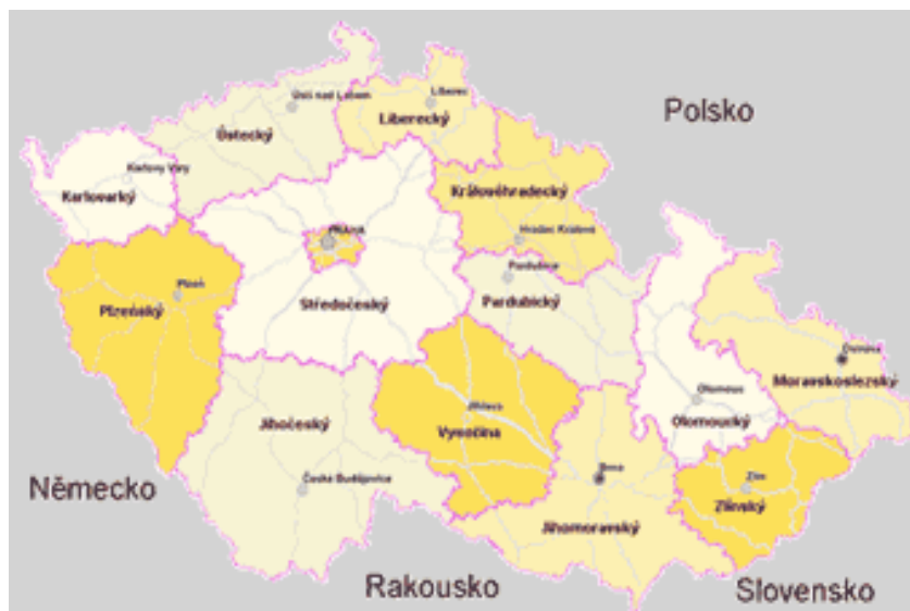
Příloha č. 1 – Mapa samosprávného členění České republiky 103