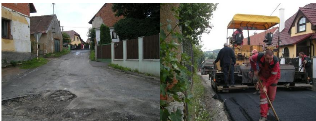
Obrázek 2 Pečice - Investiční projekt rekonstrukce komunikace po stavbě kanalizace 54

Obec Pečice každoročně žádá také o dotaci na opravu a údržbu komunikací, zatím neúspěšně.