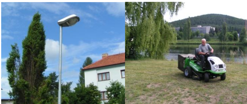
Obrázek 1 Pečice - Investiční projekt obnova svítidel veřejného osvětlení a nákup techniky na údržbu zeleně 52

Projekt byl realizován v roce 2011 na základě 4. výzvy z roku 2010 (fiche 3 – Sedlčansko atraktivní, osa 2 – Kvalitní venkov: cíl - vyšší kvalita života na venkově; dílčí cíle – zlepšení vzhledu obce, zlepšení životních podmínek obyvatelstva 53 ).