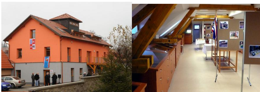
Obrázek 3 Nové volnočasové centrum Milín 73

Iniciativně se obec Milín zapojila také do projektu s názvem „Vzdělávejte se pro růst!“, který mezi léty 2011 – 2014 realizovalo ministerstvo práce a sociálních věcí. „O dotaci jsme žádali proto, abychom mohli podpořit místní vzdělávání“, vysvětluje starosta Milína důvody zapojení do projektu 74 . Pořízení lesnické techniky na konci roku 2010 bylo nezbytné vzhledem ke stavu starého zařízení.