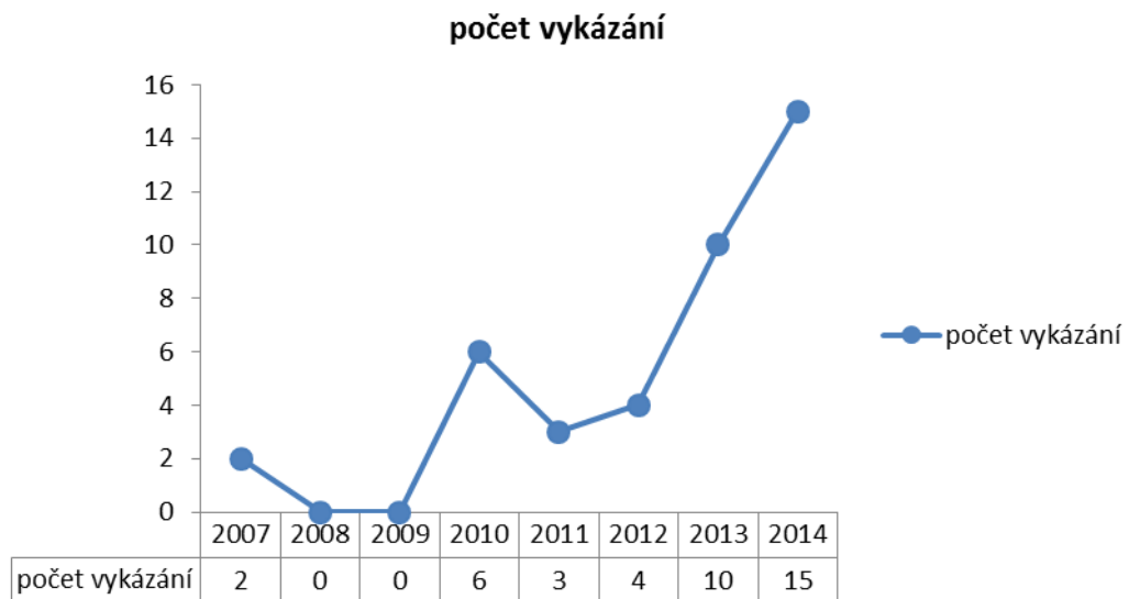
Obrázek č. 2 Počty vykázání v letech 2007 - 2014

Zdroj: Policie České republiky, interní materiál, 2015