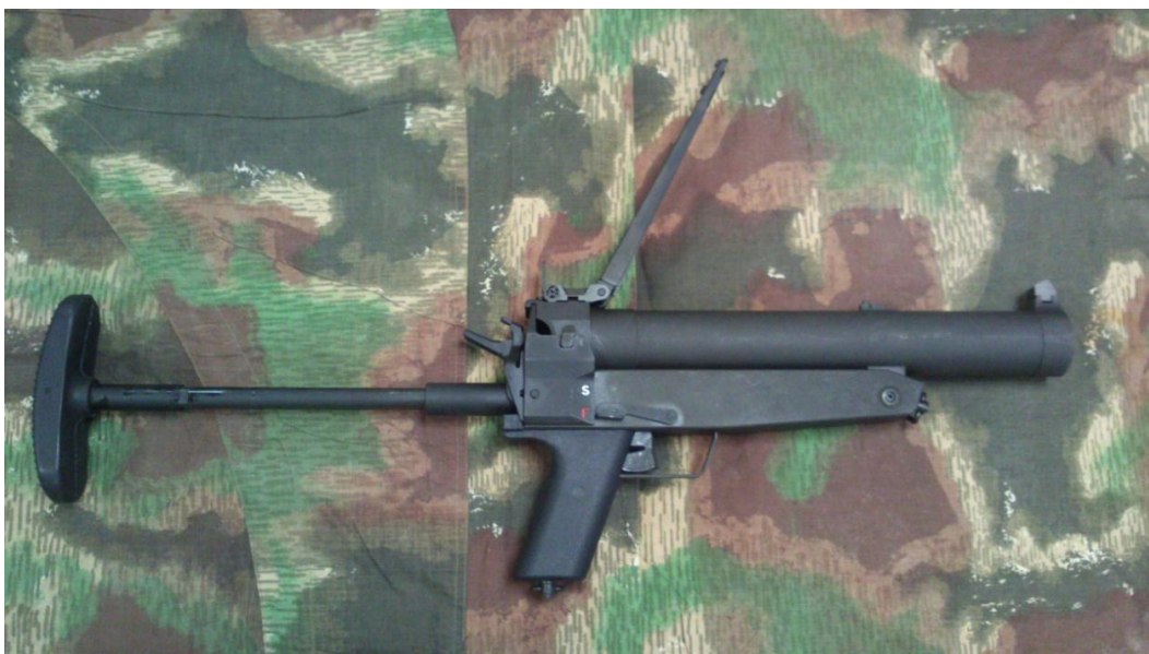
Obrázek 9: Granátomet HK 69 53