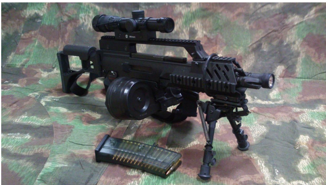
Obrázek 8: Útočná puška HK G36 50