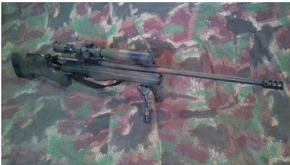
Obrázek 12: Odstřelovací puška SAKO TRG - 22 61