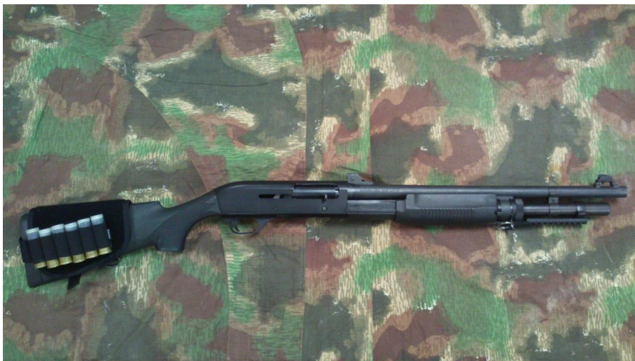
Obrázek 10: Brokovnice Benelli 56