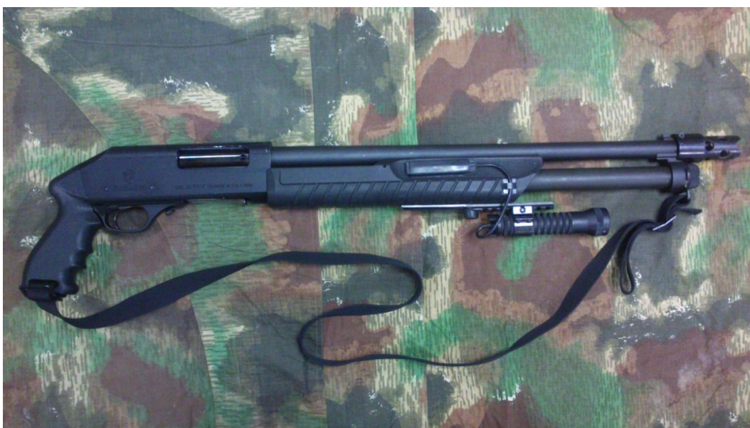
Obrázek 11: Brokovnice Fabarm 58