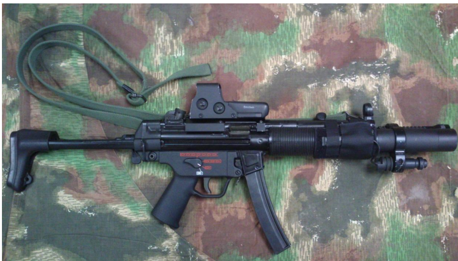
Obrázek 5: Samopal MP5 SD6 42