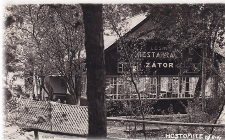
Obrázek 1 Domov Zátor - historická fotografie

Byl to menší penzion s 37 lůžky. Roku 1950 byl Zátor převzat spotřebním družstvem Jednota Hořovice do svého vlastnictví. Roku 1958 došlo k předání celého objektu z majetku Frajerových kupní smlouvou na Odbor sociálního zabezpečení Hořovice. Bylo rozhodnuto, že v Zátore bude zřízen domov důchodců. V té době to byl malý útulný domov s 35 lůžky. V roce 1959 došlo k zahájení přestavby a domov se po skončení v roce 1962 stal ústavem s 87 lůžky. V tomto období byl domov předán pod správu Okresního ústavu sociálních služeb při ONV Beroun. Okresní ústav sociálních