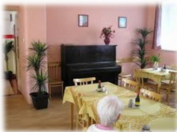
Obrázek 3 Domov Zátor - současná fotografie jídelna

Stravování v domově probíhá z vlastní kuchyně, kde se vaří strava dle jednotlivých diet. V pracovní dny mají uživatelé možnost výběru z nabídky dvou jídel, samozřejmě s patřičným časovým předstihem. Praní prádla je zajištěno vlastní prádelnou. Úklid pokojů a ostatních prostor se provádí denně. Do domova pravidelně dochází lékař, kadeřnice, pedikér, farář.