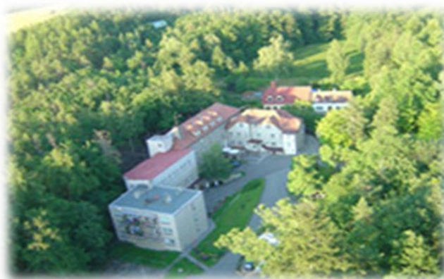
Obrázek 2 Domov Zátor - současná fotografie letecký pohled

Ani současná moderní doba neubrala nic na kráse tohoto kouzelného místa, jeho nejvýznamnější přednost lokalita, ve které se nachází, zůstala skoro neposkvřena lidskou rukou, došlo pouze k malým úpravám cesty do domova, tak, aby byla přístupna, jak pro zásobování, lékařskou službu, tak i pro uživatele a jejich návštěvy.