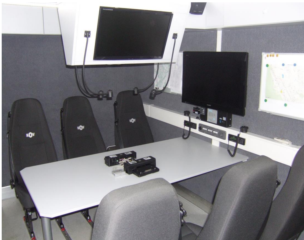
Příloha 4 – Mobilní monitorovací centrum KPJ KŘP ÚK