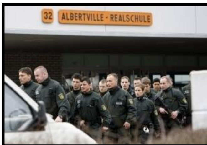
Obrázek 7: Příjezd policejních složek ke škole 75

Tim Kretschmer jakoby opět zapadal to stejného prototypu nenápadného slušného a tichého introverta, kterého by kde kdo přehlédl. Byl jedináček. A jako většina aktivních střelců měl sklony k depresím, 5 x se léčil na psychiatrii. Užíval i látky měnící psychiku. Měl taktéž zálibu v krvavých počítačových hrách a hororových filmech; doma jich měl tisíce. 76