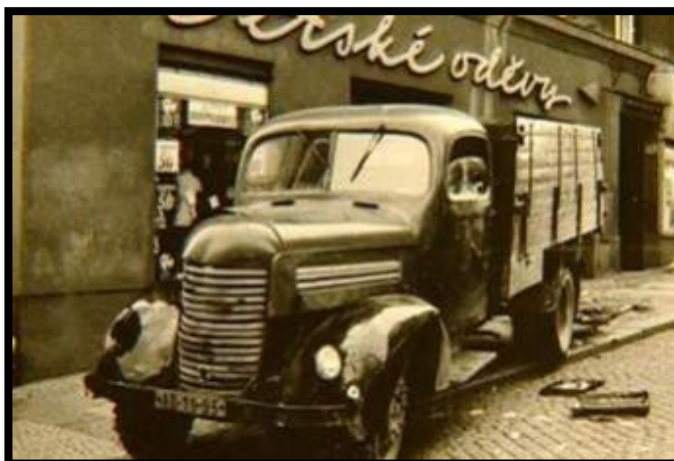
Obrázek 13: Fotografie místa činu v Praze 7-Holešovicích, třídy Obránců míru 93