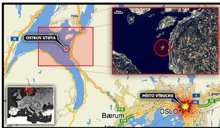
Obrázek 9: Orientační mapa události 79