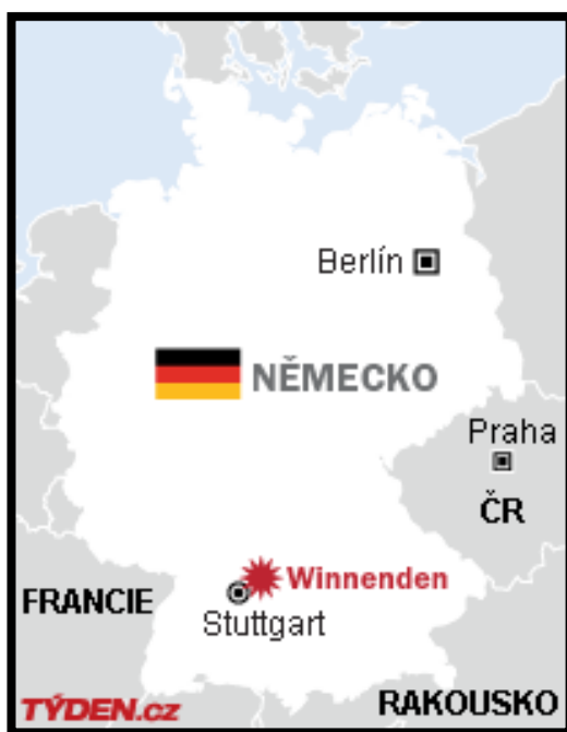
Obrázek 6: Orientační mapa Německa a místa události – města Winnenden 73

Kretschmer cestou potkal zahradníka, kterého také okamžitě zastřelil. Dále doběhl na blízké parkoviště, kde zahlédl muže, který zde čekal na manželku. Pod pohrůzkou užití zbraně jej donutil nastoupit do vozidla a odvézt ho pryč. Na místě již bylo dost policejních vozů a míjeli i tento, který ujížděl opačným směrem. Když se ho unesený řidič ptal, proč to dělá, řekl mu, že „pro legraci“. Kretschmer se začal shánět po další škole. Chtěl odvézt do dalšího 40 km vzdáleného města Wendlingenu. Řidič však při spatření další policejní hlídky prudce zastavil, vytrhl klíčky ze zapalování a utekl z vozu. Kretschmer pak musel rychle vyběhnout také a doběhl do nedalekého autosalonu Volkswagenu, kde se dožadoval klíčů od nějakého vozu. Ihned střelil jednoho prodavače do krku. Následně ještě zastřelil přítomného zákazníka. Poté vyběhl před autosalon na parkoviště, kde střílel všude kolem sebe. Nakonec jej zastavila střela z policejní zbraně, kdy po přestřelce s policií byl střelen do nohy a následně obrátil zbraň proti sobě a zastřelil se. Celkem zastřelil 15 osob na místě, další zemřela později v nemocnici. Několik dalších zranil včetně dvou policistů. Výsledek je tedy 16 mrtvých. 74