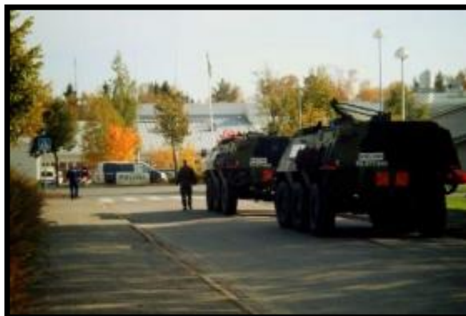
Obrázek 4: Policejní složky připravily na zásah i obrněné transportéry 67