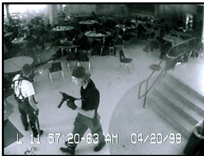
Obrázek 1: Skutečný kamerový záznam útočníků z jídelny školy 54

gonisty byli Eric Harris a Dylan Klebold. Jednalo se o studenty právě této střední školy v Columbine v Coloradu. 55