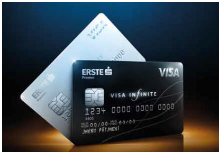
Obr. 1: Kreditní karta Visa Infinite 52