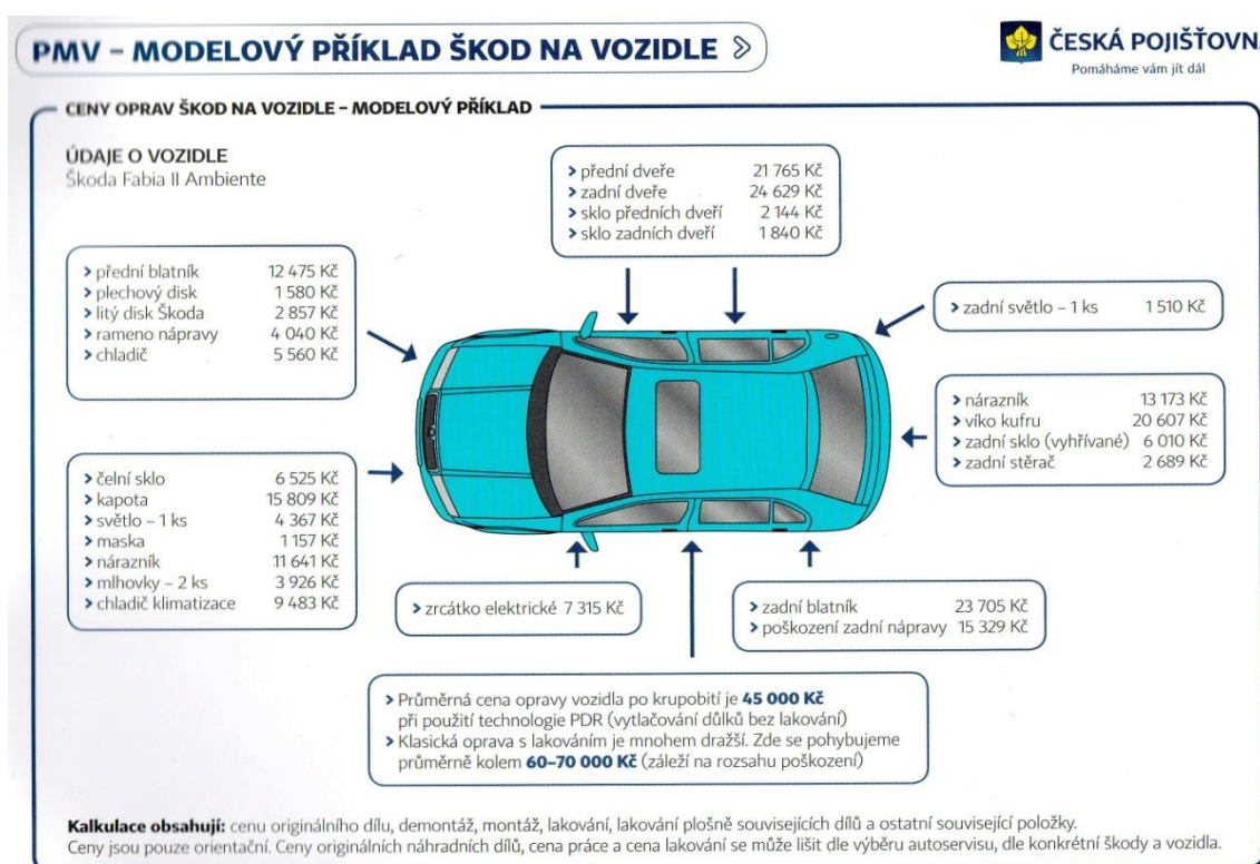
Obrázek č. 2: Modelový příklad škod na vozidle 48