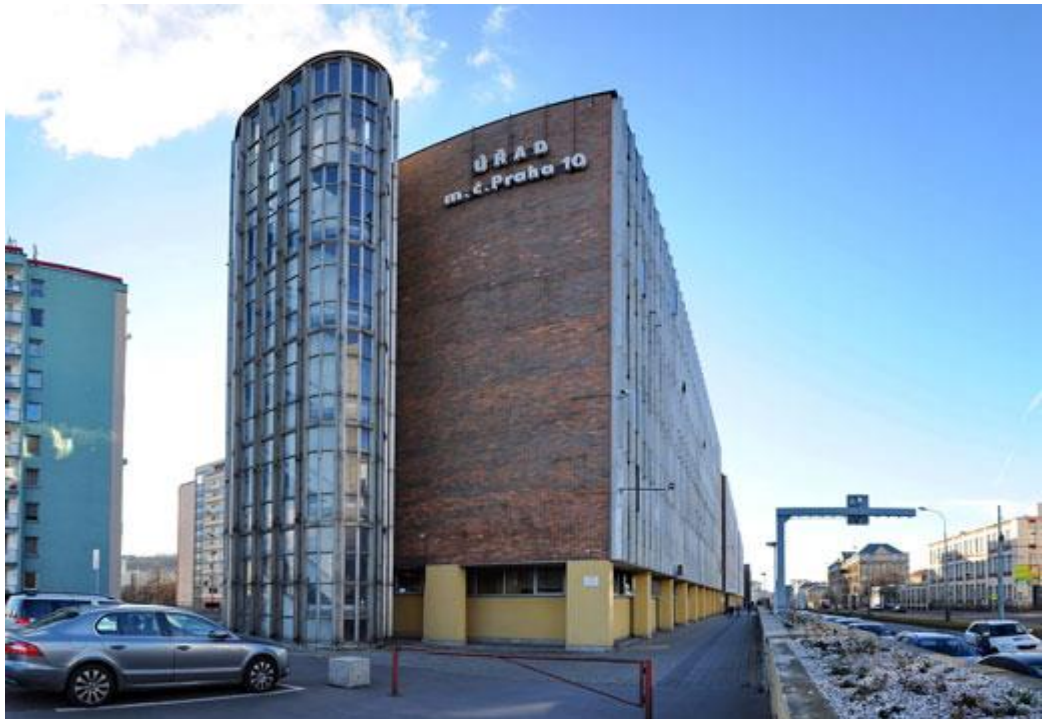
Obr. 2: budova Úřadu městské části pro Prahu 10 16

Odbor občansko-správní vykonává státní správu v přenesené působnosti v oblasti občansko-správních agend. Zajišťuje výkon státní správy na úseku matrik (sňatková, rodná a úmrtní matrice), agendu státního občanství a změny jména a příjmení. Provádí ověřování – vidimaci a legalizaci. Plní organizačně technické úkoly spojené s přípravou a provedením voleb a referend. Projednává přestupky spadající do působnosti oboru. Zajišťuje výkon státní správy na úseku evidence obyvatel. Přijímá žádost o vydání občanského průkazu nebo cestovního dokladu, předává tyto doklady a poskytuje občanům informace k vykonávaným agendám. Do občansko-správního odboru patří oddělení matrik státních občanství a vnitřní správy, dále oddělení osobních dokladů a evidence obyvatel a přestupkové oddělení.