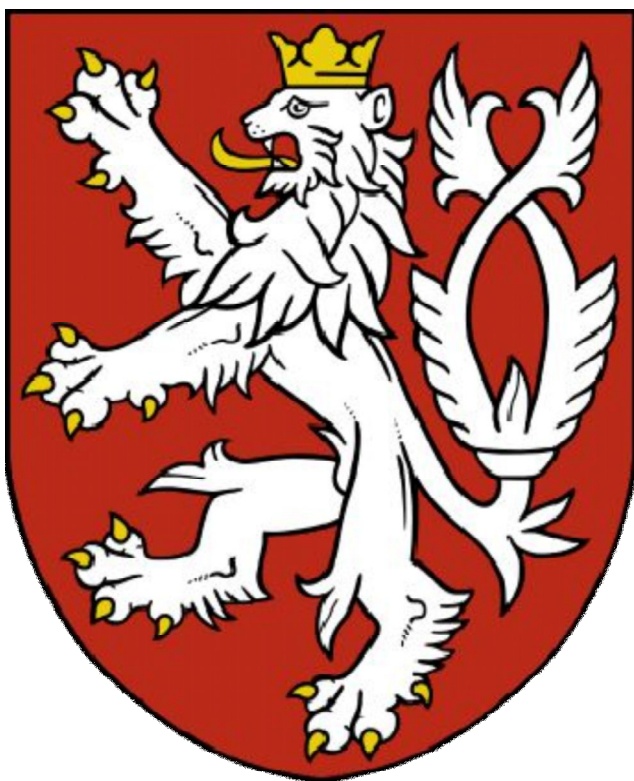
Obr. č. 1 88 Znak české státnosti