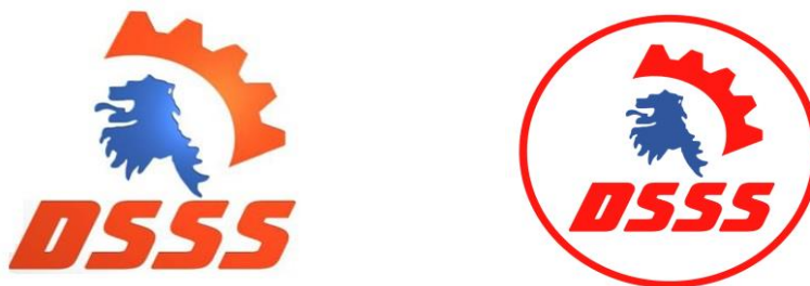
Obr. 21: Současná loga DSSS