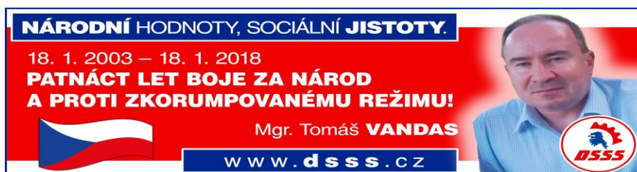
Obr. 2: Úvodní strana na Facebookovém profilu strany DSSS

Zdroj: https://www.facebook.com/dsss.cz/ .