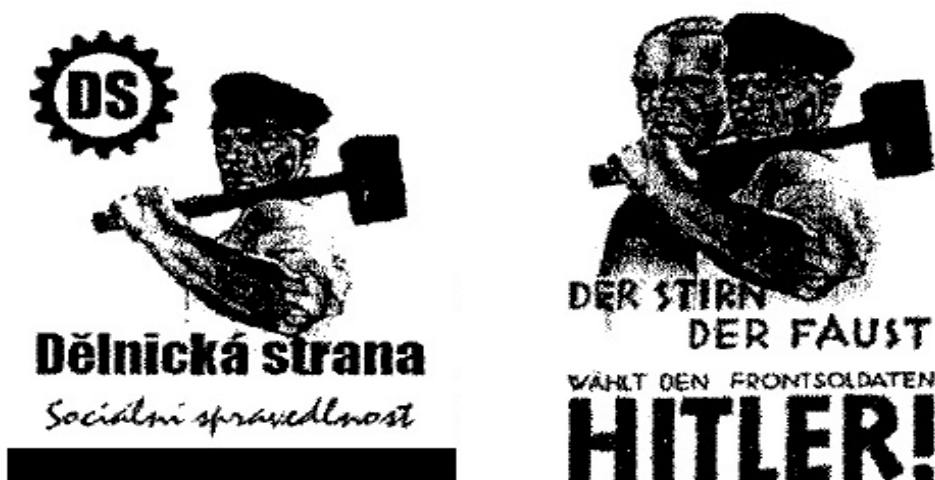
Obr. 18: Srovnání plakátu DS a NSDAP