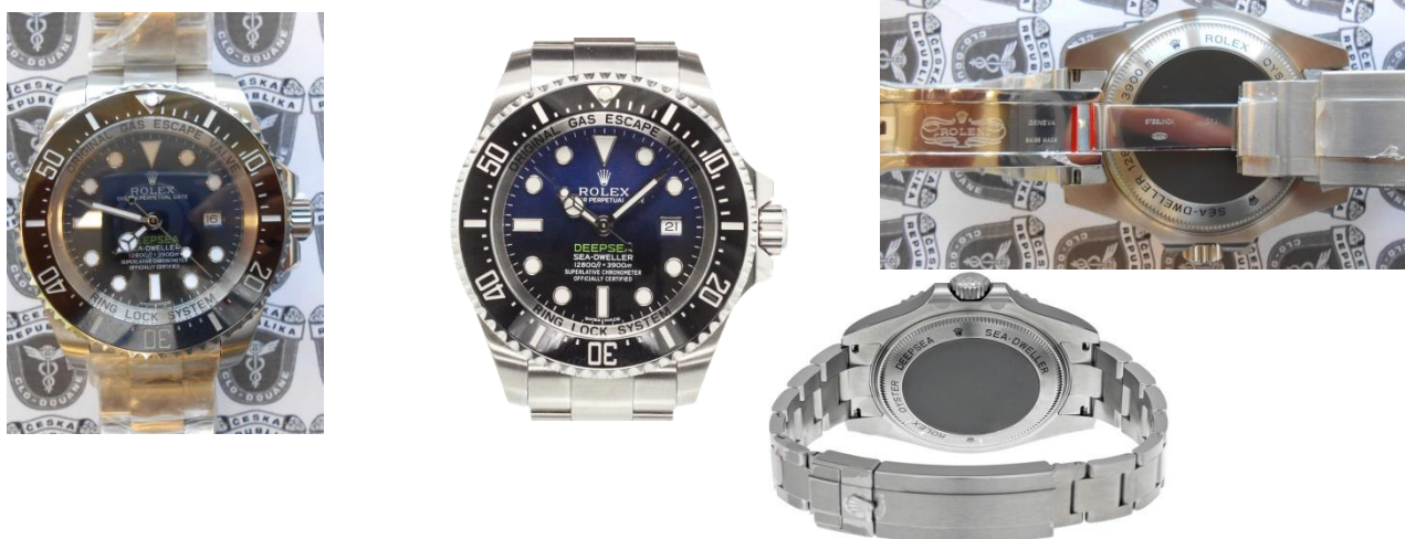
Obrázek č. 7: hodinky Rolex