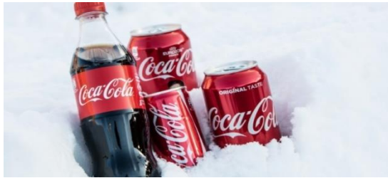
Obrázek č. 5: Tvar lahve „Coca-cola“