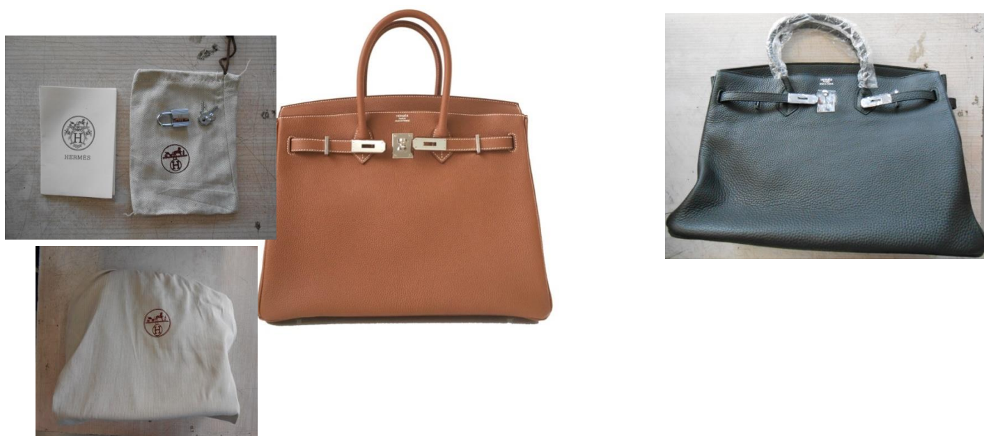
Obrázek č. 6: Kabelka