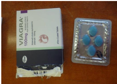
Obrázek č. 8: lék na poruchu erekce