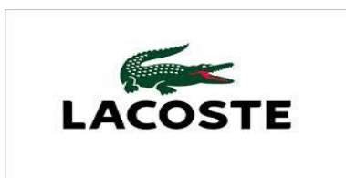
Obrázek č. 3: Znak „Lacoste“

Kombinovaná ochranná známka nebo také obrazová ochranná známka obsahující slovní prvky. Je tvořena kombinací slovní a obrazové ochranné známky. Můžeme sem zařadit například obrázek krokodýla s názvem Lacoste, též nápis Adidas a nad ním tři proužky atd... Tyto příklady obsahují jak grafické tak i slovní prvky.