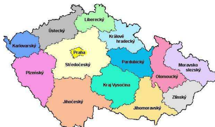
Obr. 1. Mapa administrativního členění jednotlivých krajů České republiky (dostupná z http://www.camp.cz/Images/mapy/mapa-kraje-620.jpg )

Ačkoli zprávy o prodlužujícím se životě občanů ve světě jsou potěšující, což může poukazovat na zlepšující se zdravotní péči a zlepšující se podmínky pro život, je zapotřebí si uvědomit, že tato skutečnost také přináší problémy v ekonomické a sociální sféře. Platí, že osoby ve věku nad 60 let trpí častými zdravotními problémy, v důsledku kterých spotřebují cca 60 % kapacitního zastoupení zdravotní péče. Se zdravotní péčí pak souvisejí vynaložené náklady.