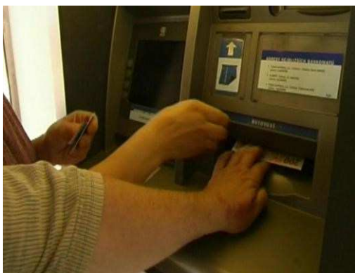
Riziko okradení přímo u bankomatu