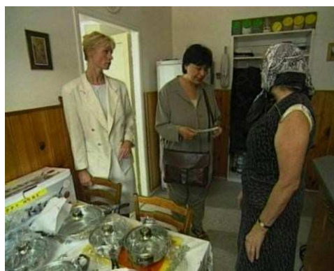
Podomní prodej a trik s rozměňováním