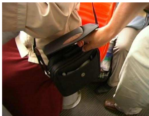
Krádeže v dopravních prostředcích