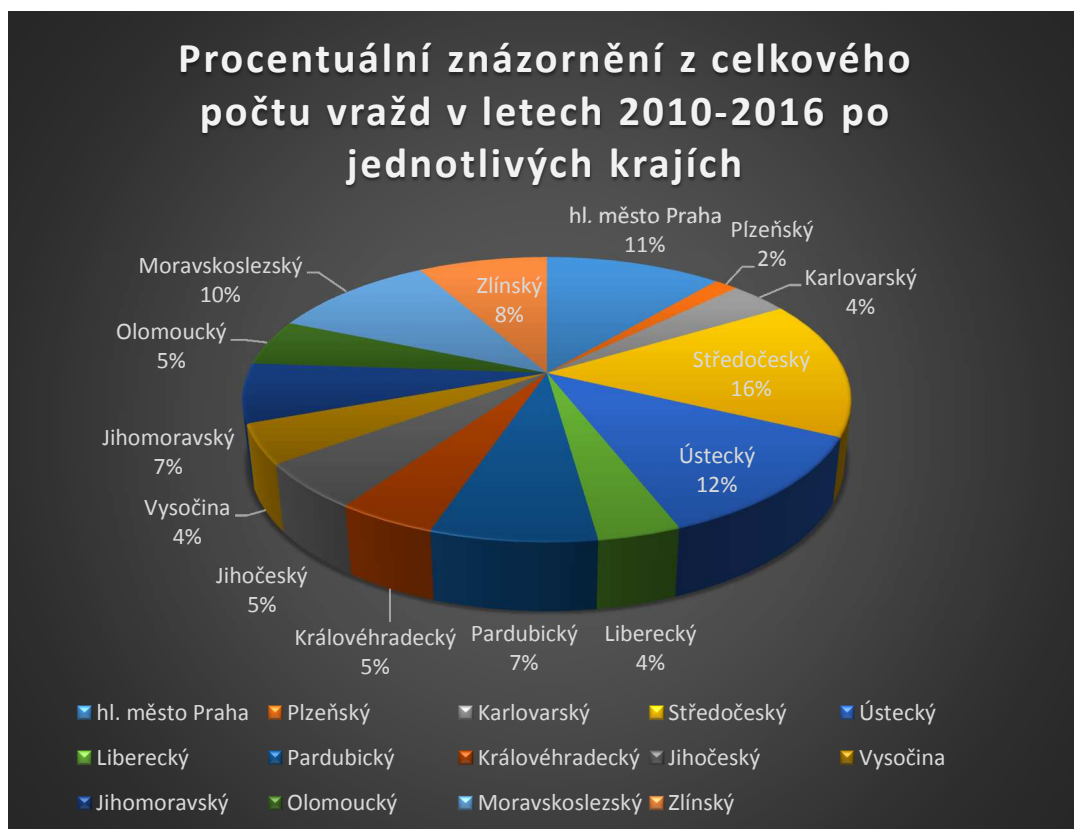
Graf. 2. Procentuální znázornění z celkového počtu vražd v letech 2010-2016 po jednotlivých krajích na seniorech ve věku nad 60 let

Pro lepší představu je tabulka převedena do grafu, který v procentech rozděluje celkový počet vražd na jednotlivé kraje.