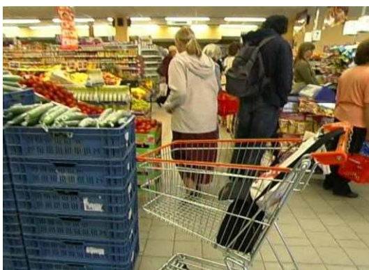
Nebezpečí odložené kabelky v obchodě