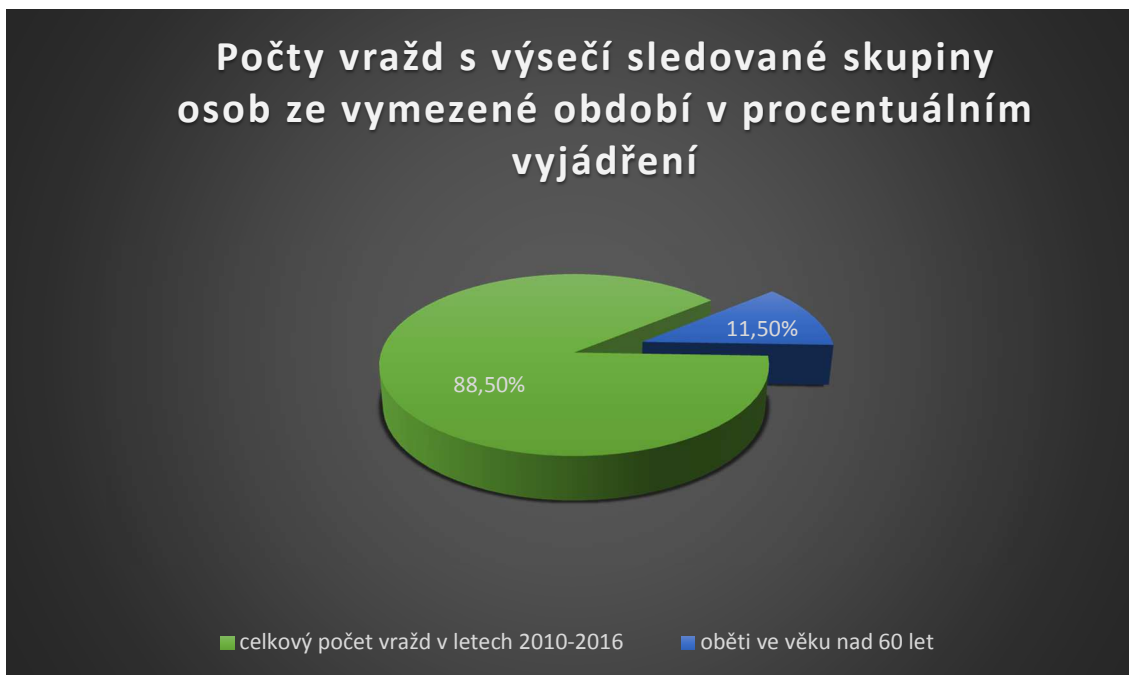
Graf 1. Počty vražd s výšečí sledované skupiny osob za vymezené období v procentuálním vyjádření

Z tabulky a grafu je patrné, že v letech 2010 až 2016 bylo spácháno na území ČR 1167 vražd (včetně kvalifikace jako pokusu trestného činu vraždy), přičemž z tohoto počtu byly ve 134 případech oběťmi senioři ve věku nad 60 let. Jedná se tedy o 11,5 % z celkového počtu, kdy lze konstatovat, že se jedná o velmi alarmující zjištění. Alarmující zejména proto, že oběťmi jsou senioři českého státního občanství, kdežto ve zbývajících 88,5 % případů jsou vraždy z velké části páčány mezi cizinci pobývajícími na území ČR.