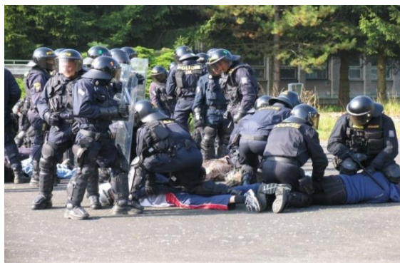
Obrázek 3 - zákrok pořádkové jednotky

Pochod za křižovatkou bude pokračovat z ulice Sirková ulicí Tyršova. Po 150 m na úrovni možnosti odbočení z ulice Tyršova do ulice Fügnerova se kolmo po pravé straně ulice Tyršova nachází místní asfaltová komunikace určená pro chodce a cyklisty, která dále směřuje podél řeky Radbuzy. Komunikace je dostatečně široká pro jednosměrný provoz těžké policejní techniky, např. Tatry 815 CAS. Na tuto komunikaci bude pochod odkloněn a po následujících 300 m dorazí přímo k prostoru před sektorem pro hosty u stadionu. Celková délka trasy pochodu činí 900 m.