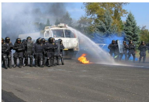
Obrázek 4 – poř. jednotka za podpory Tatry 815 CAS

Samotný pochod zpět na nádraží bude uskutečněn po totožných komunikacích. Předpokládaný odchod od stadionu je v 20:45 hod. Družstva pořádkové jednotky budou během pochodu plnit totožné úkoly, tedy jednotlivá družstva budou dav obklopovat na totožných pozicích a i technika a doprovodná vozidla zaujmou stejné pozice. O skutečnosti, že pochod je již kompletně připraven, opět velitel pořádkové jednotky vyrozumí velitele štábu, na jehož povel bude doprovod zahájen. Zprvu tak pochod projde po místní komunikaci podél řeky Radbuzy. V tomto místě bude situace kritická,