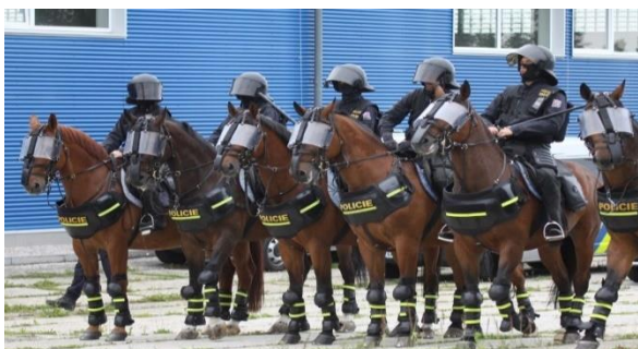
Obrázek 1 - družstvo oddělení služební hipologie

V 15:30 hod. se určené složky policie shromáždí na parkovišti před budovou hlavního vlakového nádraží, vč. velitelsko štábního vozidla pro potřeby velitele pořádkové jednotky a zástupce velitele pořádkové jednotky, označení jako Velitel 1 a Velitel 2.