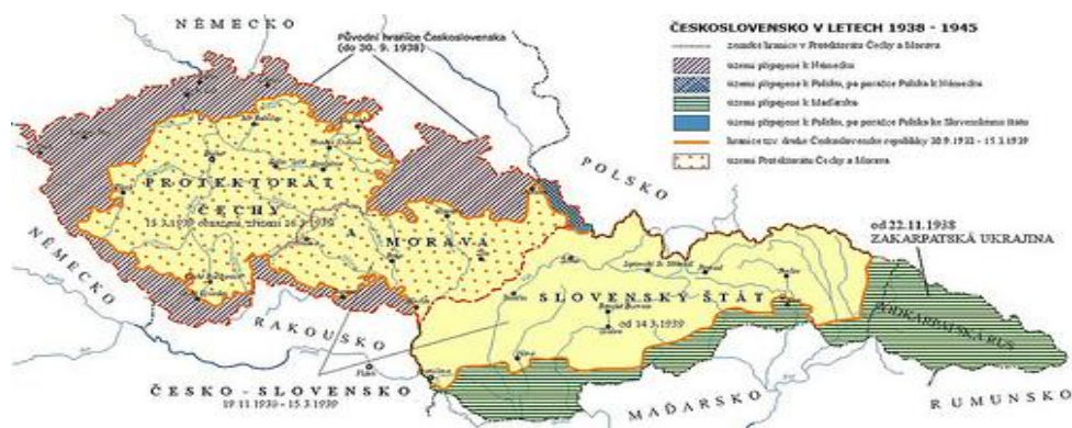
Obr. 1. Území Československa po nastolení Protektorátu Čechy a Morava