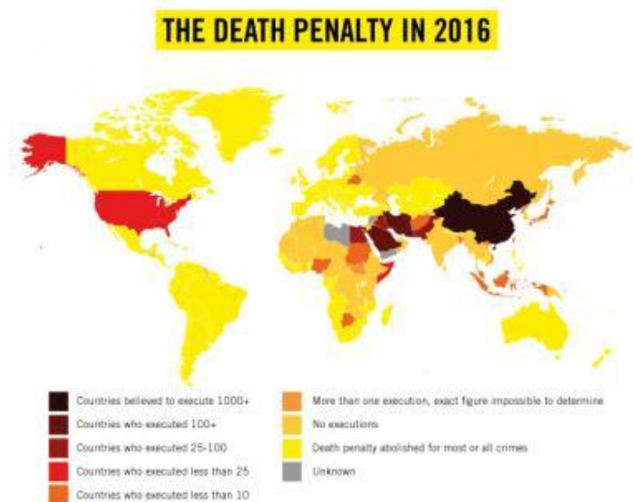
Obr. 3 – Počty trestů smrti za rok 2016 74

Čína svým prohlášením diskredituje svá prohlášení o otevřenosti. Amnesty International ve své zprávě týkající se trestu smrti pro rok 2016 upozorňuje na vysoké počty poprav v Číně, které zůstávají jedním z jejích největších tajemství. Úřady zde každoročně popraví tisíce lidí. Nová vyšetřování Amnesty International ukazují, že si čínské úřady vynucují dodržování mlčenlivosti, aby zamlžily ohromné počty poprav v zemi, a to i navzdory opakovaným prohlášením, že činí kroky směrem k justiční transparentnosti. Ve veřejném zpravodajství našla Amnesty International zprávy o minimálně 931 osobách, které byly popraveny v letech 2014 až 2016 (což je pouze malý díl z celkového počtu popravených). Ve státní databázi je však záznam pouze o 85 z nich. Databáze také vynechává odsouzené k smrti cizí národnosti za zločiny spojené s drogami, ačkoli média informovala minimálně o 11 cizincích. Množství případů, které jsou spojeny s „terorismem“ a drogovými přestupky prostě chybí. 73