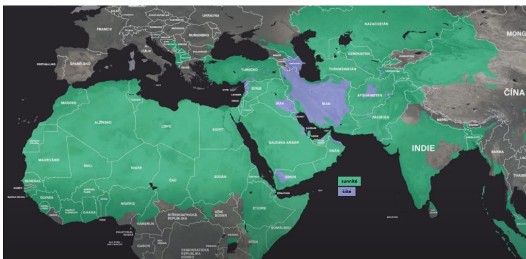
Obrázek 2 Rozdělení sunnitů a šiitů 27