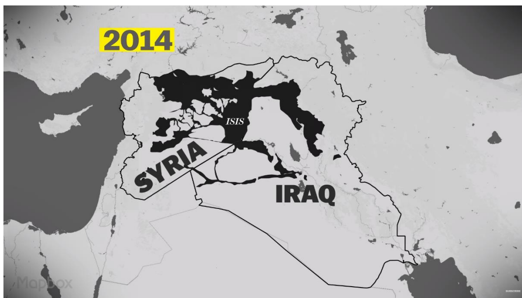
Obrázek 3 Mapa území IS z roku 2014 54

O necelý rok později, 30. září 2015, spustilo ruské letectvo bombardování Sýrie, od afghánské okupace v osmdesátých letech, největší vojenskou akci Moskvy v zahraničí. Nejdříve se ruské letectvo zaměřovalo především na povstalce, kteří ohrožovali syrský režim prezidenta Baššára al-Asada v západních částech země a u pobřeží Středozemního moře, tedy nikoli na IS. Syrská armáda díky této podpoře ruských letadel a vrtulníků přešla do ofenzivy a začala dobývat zpět území, která měsíce předtím ztrácela. Na konci března 2016 vyhnala syrská armáda s ruskou leteckou podporou IS z Palmyry a zachránila pozůstatky antického města. 55 IS bojuje s nepřáteli na všech stranách a prohrává. Do srpna roku 2017 ztratil IS 60% svého kontrolovaného území a populace je dva a půl milionů obyvatel. 56