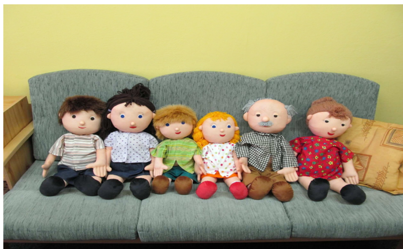
Obř. 6: Demonstrační loutky – rodina 65

Demonstrační loutky JÁJA a PÁJA byly doplněny o další anatomické loutky, které aktuálně zobrazují celou rodinu, ve smyslu několika generací. Všechny tyto loutky jsou provedeny tak, aby motivovaly dítě ke hře. Tyto loutky jsou také vybaveny sekundárními pohlavními znaky (bez detailních napodobenin). Loutky se při výsledku stávají symbolickým, neverbálním komunikačním prostředkem. Loutka může představovat samotné dítě nebo kohokoliv jiného. Vždy je vhodné jmenovitě určit, koho loutka představuje. Loutka se předkládá dítěti vždy oblečená. Z rozhovorů specialistů dále plyne, že je vhodné dítě v průběhu výsledku utvrzovat, že to, co dosud řeklo a předvedlo je správně.