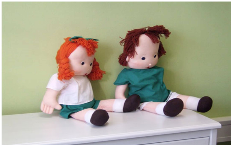
Obr. 5: Jája a Pája 64

osobní údaje vyslychajícího, čas ukončení výslechu, druhým důležitým atributem je záznam zvuku), tak aby mohl být užit jako věrohodný důkaz před soudem.