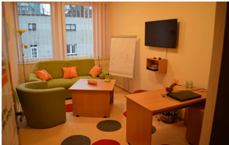
Obr. 4: Speciální výslechová místnost Liberec 62

téměř na záznamu neslyšitelné, v případě následného přepisu výslechu je uvedené velkým problémem).