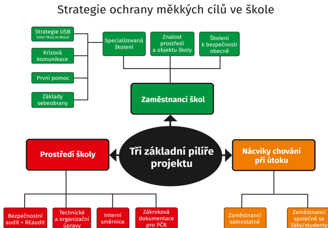
Obrázek 2 - Schéma „Strategie měkkých cílů ve škole“