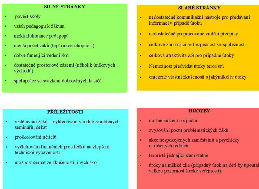
Obrázek 3 - Analýza oblasti "Zajištění bezpečnosti ZaMŠ Katovice" 45