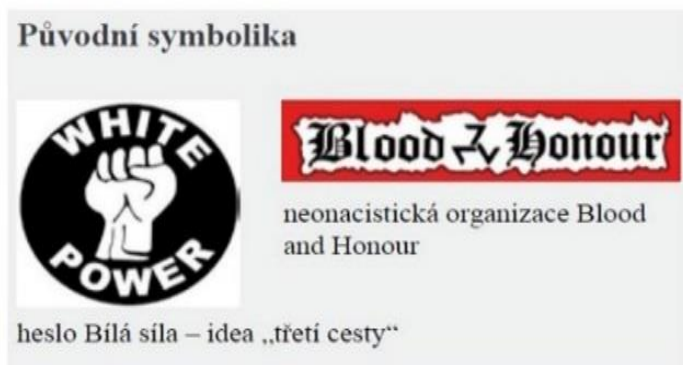
Obrázek č. 1: Symbolika uskupení White Power a Blood and Honour