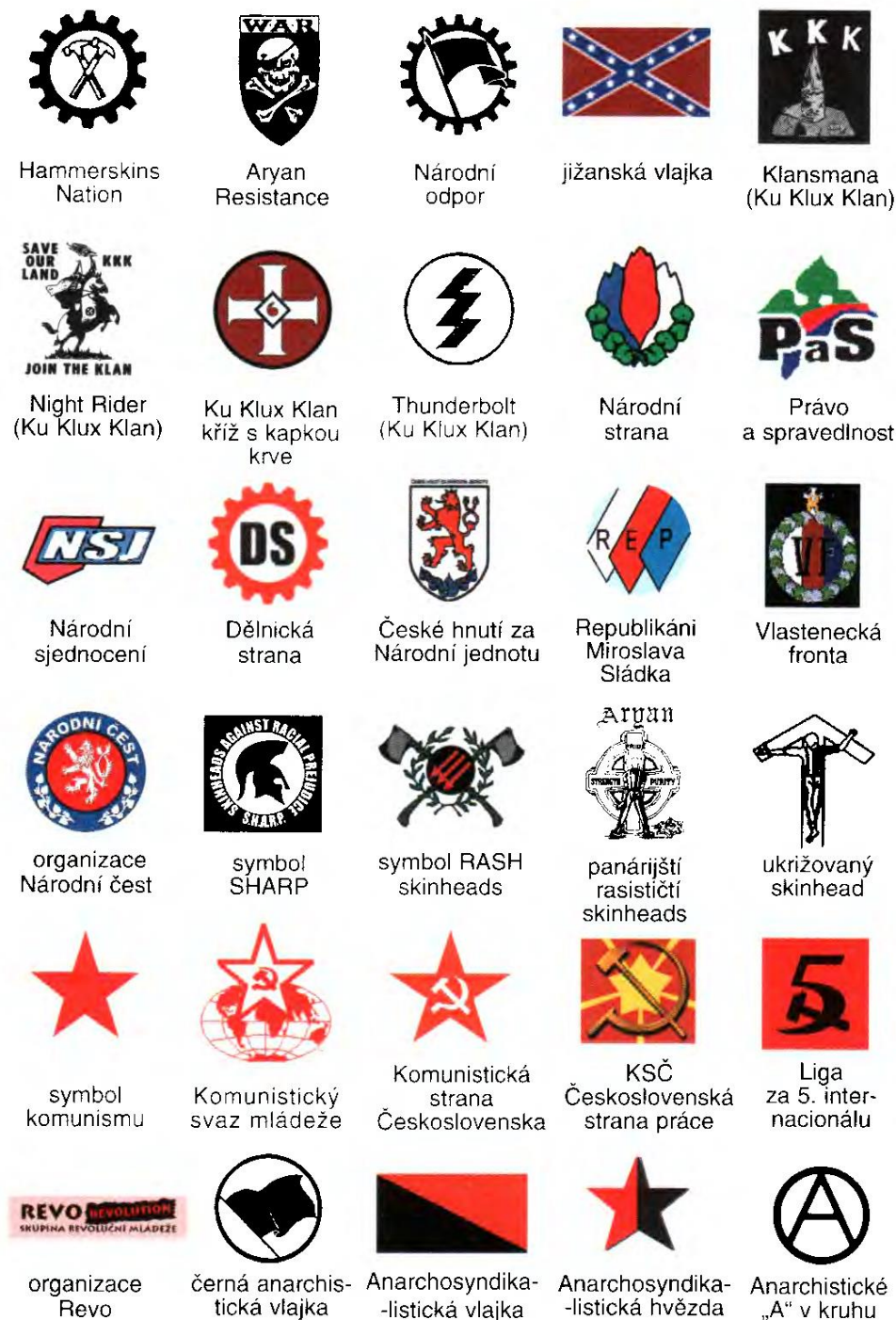
Obrázek č. 3: Symboly používané extremisty na území České republiky