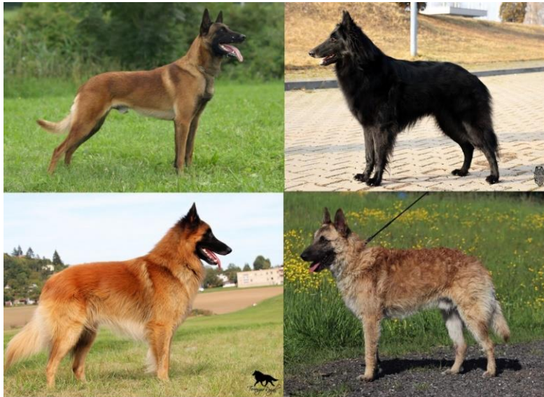
Obrázek 2 Čtyři varianty belgických ovčáků 34

Nejoblíbenějším a zároveň jediným pracovním plemenem ze čtyř vyšlechtěných se stal malinois, hovorově maliňák.