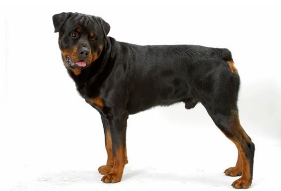
Obrázek 4 Rottweiler 42

Rotvajler se postupem času z nahánění domácího skotu stal nejen služebním psem, ale i rodinným příslušníkem. Výchova rotvajlera závisí na majiteli. Je to pes vhodný k hlídání objektů, ale se svou velkou dominancí může u nezkušeného majitele vzniknout problém. Rotvajleři se stále chovají i pro odbor služební kynologie a jsou využíváni převážně pro hlídkovou službu.