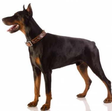
Obrázek 3 Dobrman 38

Dobrman (anglicky doberman) je velmi vysoký (výška v kohoutku se pohybuje okolo 70 cm) a hrudníkem mohutný pes, vážící okolo 45–50 kilogramů. Je to velmi aktivní, ostražitě plemeno, které vyžaduje důraz ve výchově. U špatně zvolené výchovy a výcviku dochází často k projevům agrese. Dobrman není vhodné plemeno pro začínající chovatele. 37