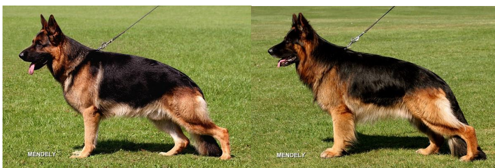
Obrázek 1 Standard německého ovčáka krátkosrstého (vlevo) a dlouhosrstého (vpravo) 29

Německý ovčák patří mezi plemena střední velikosti. Ideální kohoutková výška se pohybuje u psů okolo 62 cm a u fen okolo 58 cm, kdy je povolena maximální odchylka 2,5 cm nahoru i dolů. Silně stavěné končetiny zajišťují ovčákům maximální oporu s velkým osvalením. Německý ovčák jako služební a pracovní plemeno musí být lhostejný ke střelbě, ostražitý, odvážný, poslušný, vlídný ke svému okolí, ovladatelný a nesmí být u něj projevy agrese vůči lidem včetně dětí, ostatním psům nebo jiným zvířatům. 28