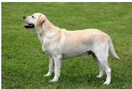
Obrázek 7 Labradorský retrívr – žlutý 51

Obecně retrívři jsou velmi dobří plavci s citlivým nosem, který se u speciálně kynologických prací velmi často využívá k vyhledávání drog nebo výbušnin. Dále jsou využíváni Horskou záchrannou službou ČR k vyhledávání osob, nebo často slouží jako asistenční psi a psi vhodní ke canisterapii.