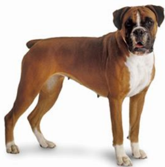
Obrázek 5 Německý boxer 44

Toto plemeno je stejně jako většina dalších služebních plemen velmi energetické, veselé a rádo se učí novým povelům. Výcvik není náročný a je vhodný do rodiny s dětmi. U výchovy je opět velmi důležitá důslednost a přiměřená tvrdost, která nesmí přesáhnout pomyslnou hranici. Boxer nesnese nespravedlivé tresty. 45