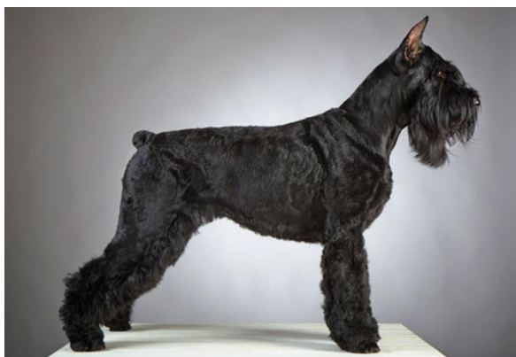
Obrázek 6 Knírač velký 48

Výchova knírače není náročná. Jde o velmi veselé a učenlivé plemeno, které nedůvěřuje cizím lidem. Knírač velký se dá vycvičit k hlídání majetku, ale je zapotřebí důslednost, protože se často objevuje tvrdohlavost.